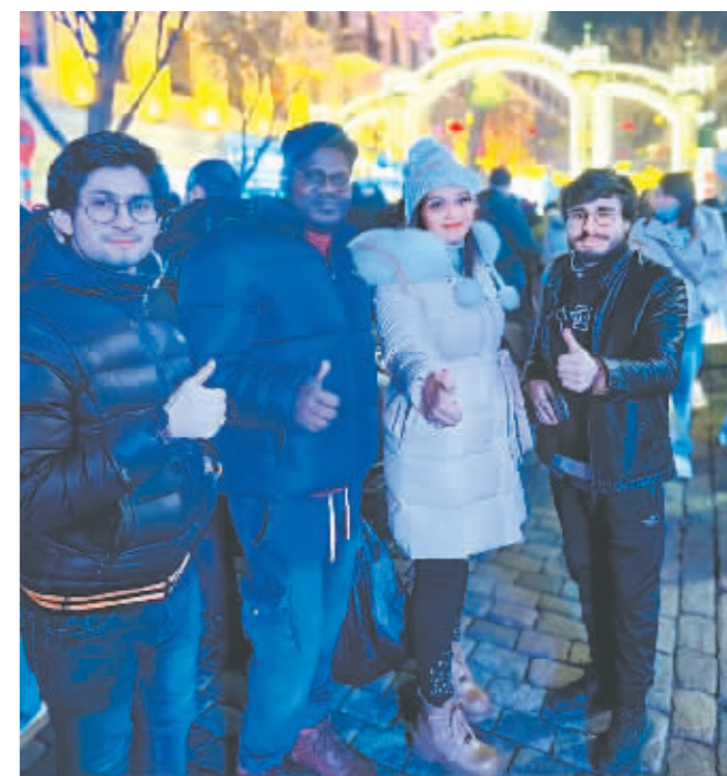
外国游客打卡中央大街。

本报讯(记者 刘姝媛/摄)这个冰雪季,中央大街成为“最火商圈”之一。日前,中央大街迎来了许多外国面孔,一批来自美国、英国、澳大利亚、俄罗斯、德国、意大利、沙特、阿尔巴尼亚、泰国、新加坡、肯尼亚、西班牙等国家的外籍游客来到这里,体验百年老街的文化韵味。他们不时拿出手机、相机定格美景,在街区合影留念。