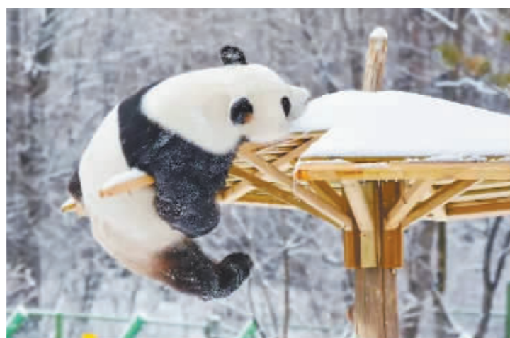
亚布力熊猫馆憨态可掬的大熊猫。