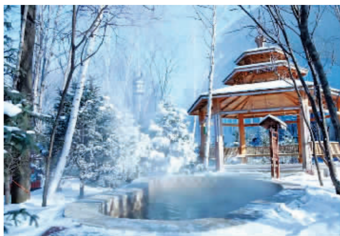
独特特色的亚布力温泉。