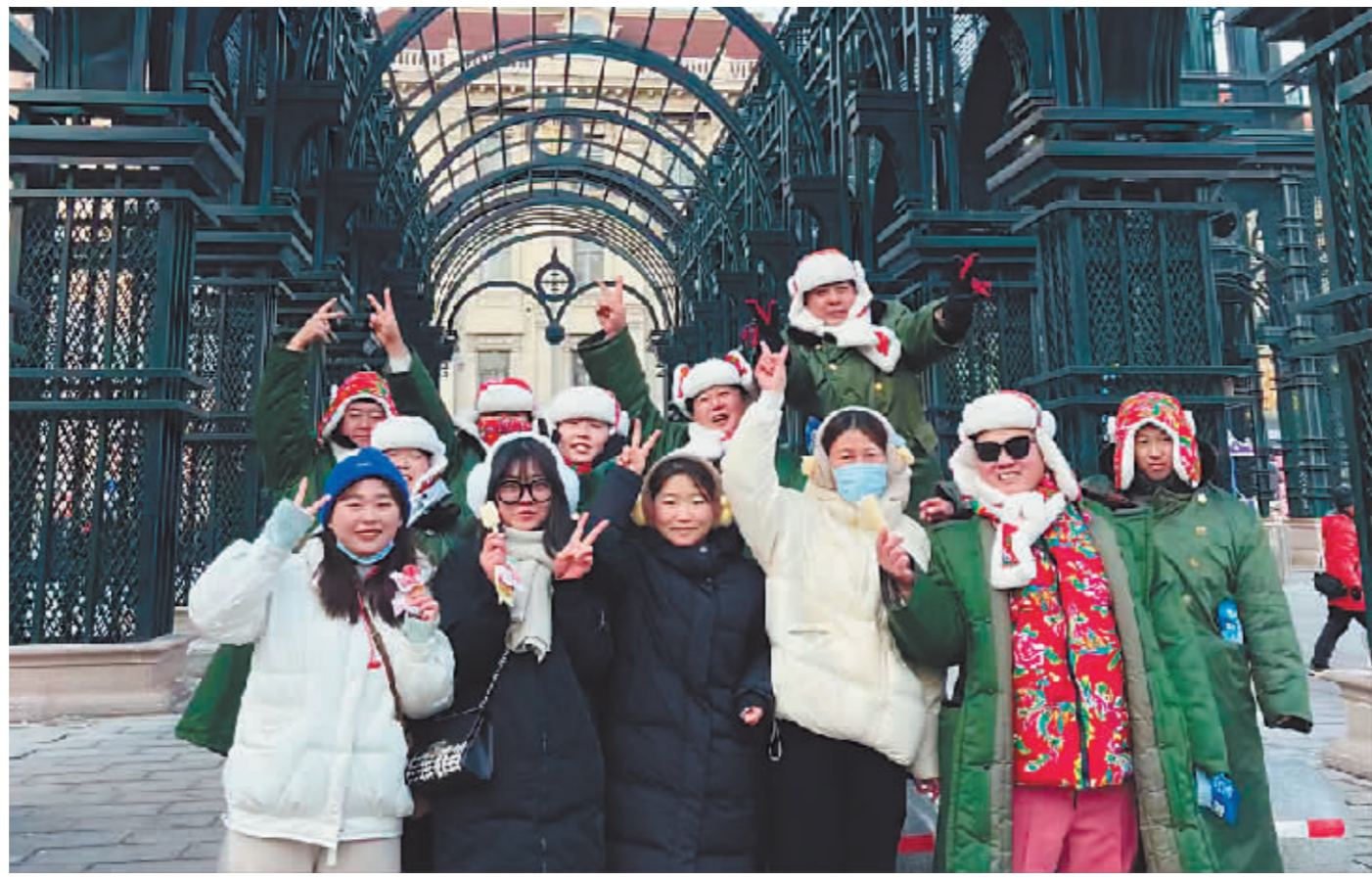
大奇团队带领外地游客畅玩冰城。

2023年,他的团队扩大,其中,全媒体部门涵盖了文案、拍摄、剪辑、置景等短视频制作全链条岗位。目前,公司有抖音、小红书等账号十多个,一半客户是看着视频找来的。与传统的旅游推广方式相比较,短视频的推广效果“杠杠的”——不仅是国内游客,来自新加坡、澳大利亚、马来西亚等