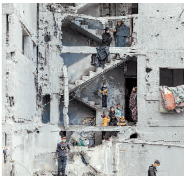
▲在加沙地带南部城市拉法,人们查看以军空袭后的废墟。