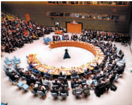
2月23日,在位于纽约的联合国总部,安理会举行乌克兰问题高级别公开会,与会各方呼吁通过政治手段解决乌克兰危机。

2月24日,乌克兰危机升级满两年。当前乌克兰局势依然错综复杂,冲突双方付出了巨大代价,部分西方国家则持续“拱火浇油”。拉锯之下,和平谈判前景依然渺茫,这场冲突如何发展、何时结束依然是未知数。