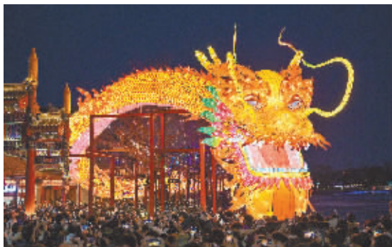
在北京市西城区什刹海荷花市场拍摄的巨型灯笼“蛟龙出海”。