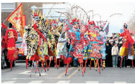
乡村社火队演员在河北省涿鹿县的社火展演上进行踩高跷表演。