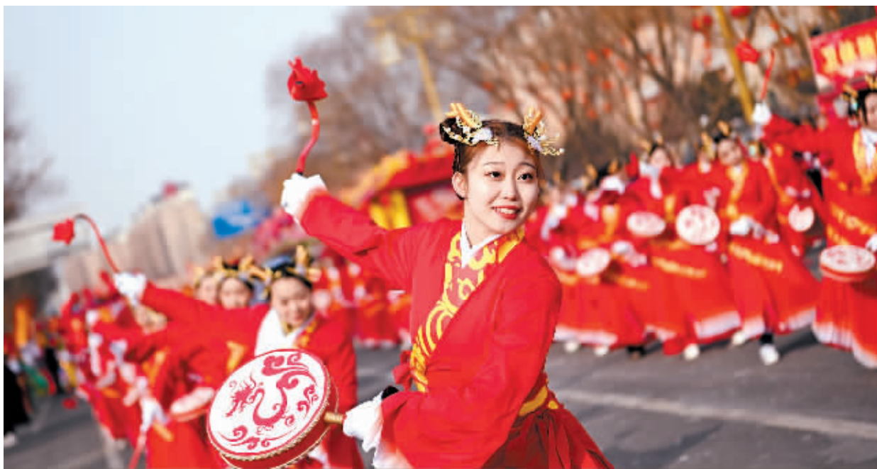
演员在山西省大同市广灵县街头进行秧歌表演。