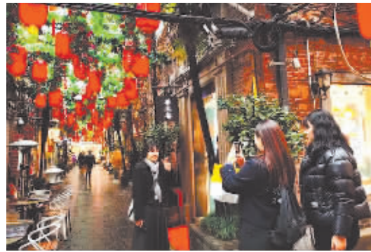
▲游客在上海田子坊拍照“打卡”。 ▲“厦门海上游”项目闽南复古龙船造型游船行驶在鹭江。