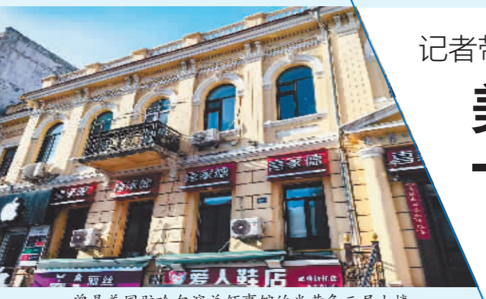
曾是美国驻哈尔滨总领事馆的米黄色三层小楼。

如今,原领事馆临街的一层和地下室都已改为商业门市用房,人们在这里购物、用餐……这栋老建筑在繁华的秋林商圈书写着新的历史。记者实地走访发现,这栋楼正面保存得相对较好,米黄色的墙体、白色的线脚、弧形窗……似乎仍在讲述着一个世纪以前的风云变幻。穿过楼旁的门洞,记者来到东大直街291号的后院。与涂刷成米黄色的前脸不同,建筑背面是极具古感的红砖墙体,门窗依然保持着原有的形态。一束阳光从窗的间隙洒下,仿佛穿透历史的尘埃,默默诉说着过往与现在。