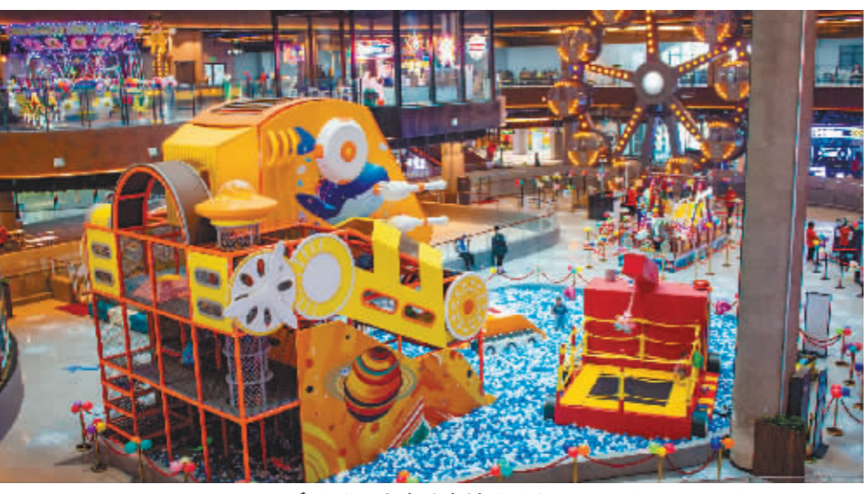
四季游乐馆内多种多样的游乐设施。

同下乘坐。随着升降塔启动,带着游人急速大幅度一上一下运动,坐在上面的人能充分体验到失重感,不少孩子痛快地大呼“好玩!”