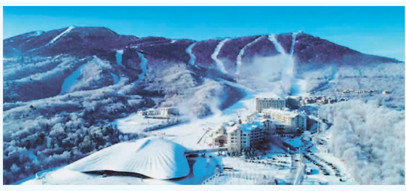
亚布力滑雪旅游度假区。