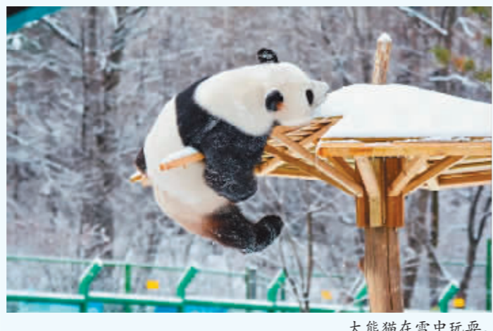
大熊猫在雪中玩耍。