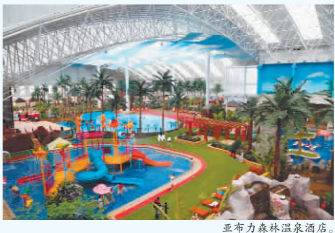
亚布力森林温泉酒店。

的药浴温泉,是黑龙江省唯一的富硒温泉。室外温泉分布在原生态白桦林和松林中,冬季还可以体验雪地温泉,别有一番乐趣。