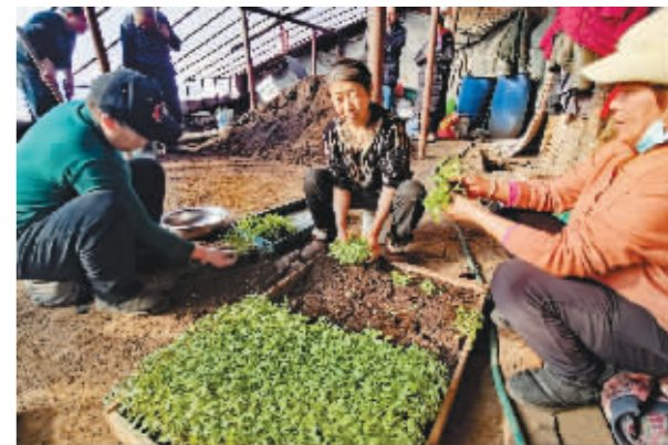
大棚内村民进行分苗工作。

本报讯(吴昌林 记者 刘媛文/摄)浓郁的年味并没有让香坊区幸福镇光明村的种植户停下脚步,在庆新春之余,他们抢抓农时,忙生产、查行情。