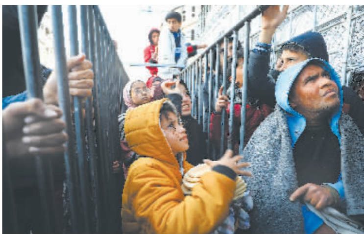
2月19日,巴勒斯坦人在加沙地带南部城市拉法等待购买食物。

“我们必须继续向以色列施压,让他们知道在拉法街道上还有太多的人,(一旦开打)避免平民伤亡是不可能的事情。”欧盟外交与安全政策高级代表何塞普·博雷利说。