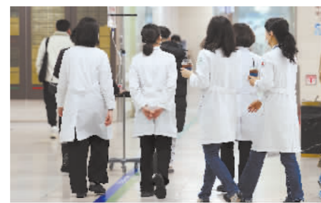
2月19日在韩国光州一家医院拍摄的医疗工作者。

据新华社电 韩国首都圈五大医院上千名实习医生和住院医师19日集体辞职,以抗议政府扩招高校医学生的政策。韩国媒体报道,如果这些医生集体离岗,一些医院恐无法正常运转,韩国医疗系统危机将升至最高级。