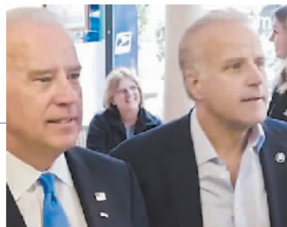
乔·拜登和比他小7岁的弟弟詹姆斯(右)。

据悉,因经营不善,“美国核心”公司于2019年申请破产,抛弃了不少患者,留下一堆官司。针对该公司最为