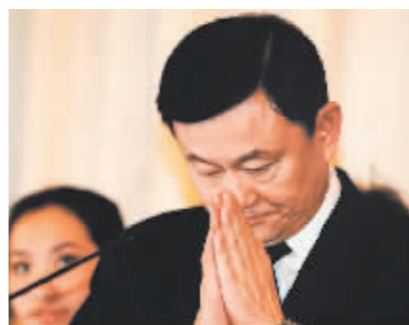
▲2008年2月28日,他信在曼谷出席新闻发布会。