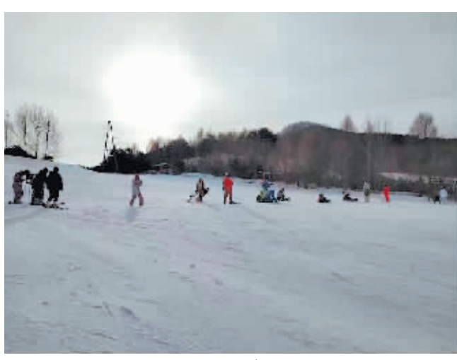
游客在阿城滑雪场体验滑雪乐趣。

本报(记者 康福柱)阿城玉泉是“中国现代冰雪运动登陆地”,这里有多家滑雪场,早春时节,不耽误游客体验滑雪,同时,还能参观酒文化展览馆,到现代农业设施园区采摘草莓,实现一站式出游。