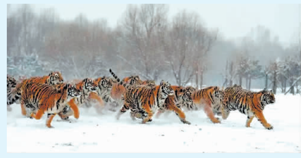
▲东北虎林园里东北虎在雪地玩耍。

热雪奇迹拥有初、中、高级共8条不同坡度雪道,最高垂直落差80米。大熊猫和松鼠道适合初级滑雪者;小熊道适合入门滑雪者;雪兔道和麋鹿道适合中级滑雪者;老虎道、黑龙道、公园道适合高级滑雪者。一楼还设有1.5万平方米超大娱雪区能够满足各类雪友娱雪需求,让更多人感受冰雪乐趣。