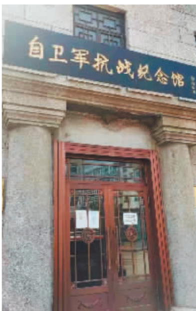
自卫军抗战纪念馆。

吕厚民先生是在依兰成长的著名摄影艺术家。作为毛泽东主席身边工作时间最长的摄影师,吕厚民先生用他的