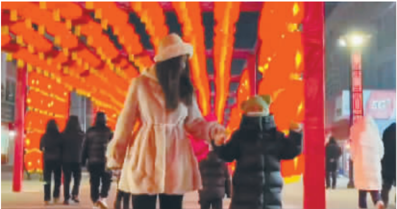
巴彦步行街“花灯集市”。

继续沿江北岸而上,就到了古城巴彦县。正月十五闹花灯,虽然正日子还没到,但巴彦步行街上准备了“花灯集市”。这是巴彦县今年打造的文旅景观之一,近万盏红灯笼将年俗文化与尚德文化充分融合,寄托了人们对美好生活的无限向往,也表达了热情红火的巴彦敞开门、欢迎八方来客的期待与真诚。