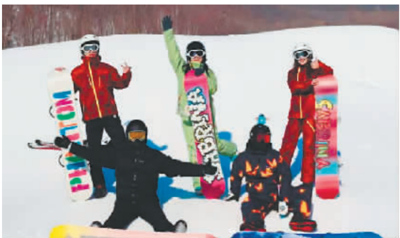
游客在滑雪场滑雪。