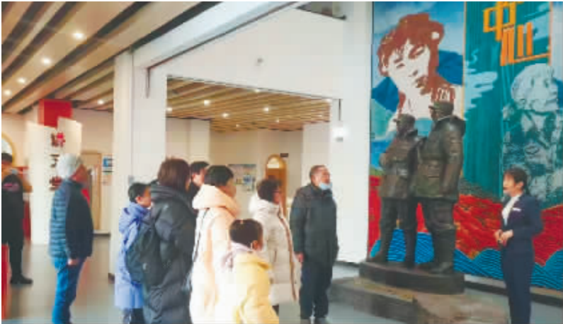
马旭文博艺术中心。