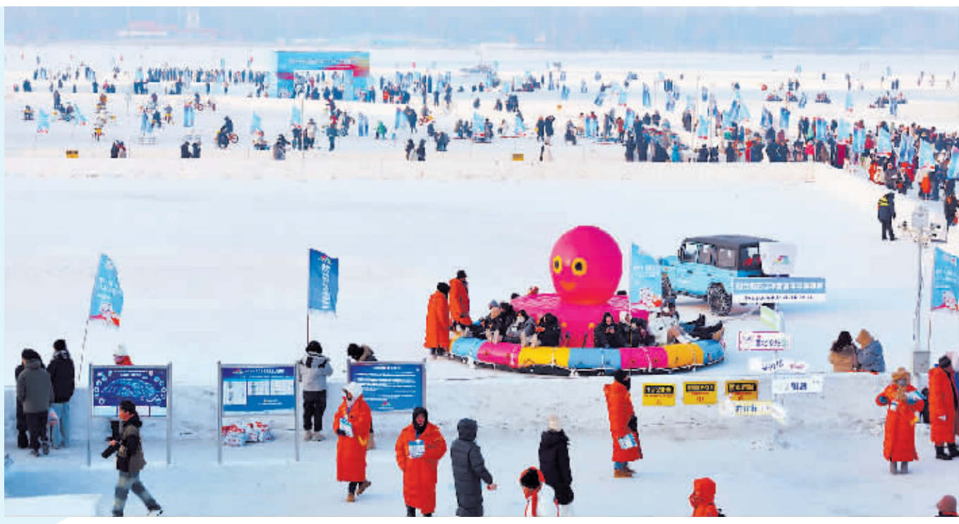
游客在景区内游玩。

作家毕淑敏说过,旅行不仅是行走,更是与自己的心灵和解、与世界温柔相拥的过程。这个冬天,哈尔滨成为国内旅行目的地的“顶流”,中央大街、索菲亚教堂、冰雪大世界……银装素裹的“童话世界”让无数人心神向往、集体奔赴。 有人试图破译流量密码,想弄清是什么魔力让小伙伴们无视遥远的距离和巨大的温差,千里迢迢赶赴一场冰雪之约:是瑰丽磅礴的冰雪奇观?是温暖而又烟火气十足的城市底色?抑或是刚刚离开几天就开始忍不住想念,甚至带上朋友二刷的“东北情愫”? 每个读者心中都有一个哈姆雷特,每位游客心中都有一个哈尔滨。相信每一位来过哈尔滨和即将来哈尔滨的游客心中,都有自己的答案。