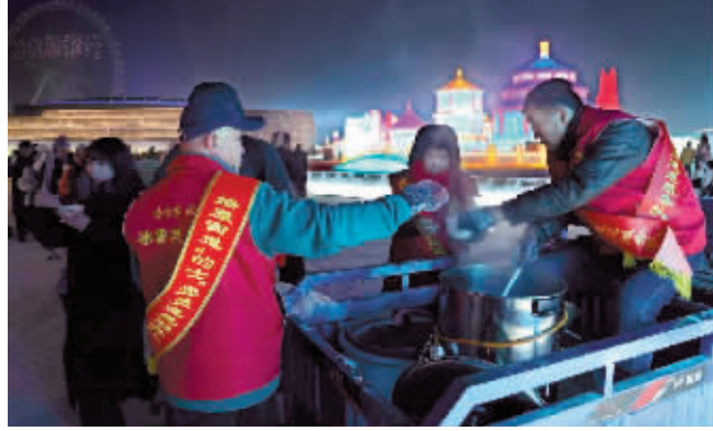
志愿者向游客发放饺子和热水。

本报(柏凡露 记者 梁可心)春节假期,南岗区热心志愿者们放弃合家团圆的幸福时刻,默默坚守在志愿服务岗位上,为游客们送上暖胃的红糖姜水、暖心的“爱心饺子”,让外地游客在寒冷的冬日里感受到来自“尔滨”的浓浓爱心和热情。 为了让游客们在临时等候的时间里能够取暖避寒,南岗区委宣传部招募的冰雪旅游志愿服务者,默默坚守在冰雪大世界出口处的南岗区“的士”党员志愿服务驿站,为游客送上暖心服务。 从农历小年起,志愿者们就每天在志愿服务驿站为游客们送上“爱心水饺”,将4种不同口味的饺子煮好后盛到小碗内供游客品尝。除夕夜,志愿者们依然值守在冰雪大世界,当游客们走出冰雪大世界后,志愿者们主动热情地招呼游客们到服务驿站歇脚避寒,品尝饺子充饥,喝口红糖姜水暖胃。 广东省来哈的一家三口吃完饺子后感动地说:“我们本来是来游玩的,没想到还能在这里吃到这么美味的饺子,真的是太感谢你们了。‘尔滨’真好,我们还会再来。” 春节期间,南岗区冰雪旅游志愿者们已为3500余名游客送上500余斤“爱心饺子”,让他们在异地他乡感受到了和家一样的节日气氛。