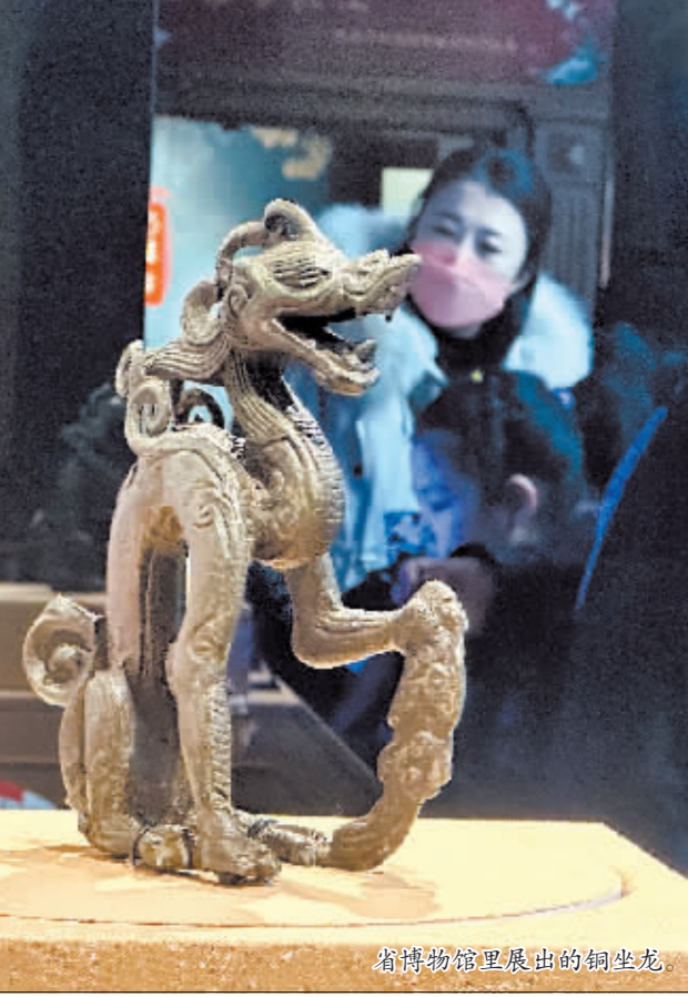
省博物馆里展出的铜坐龙。