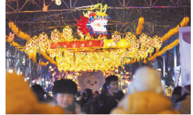
百年老街上的巨龙彩灯。