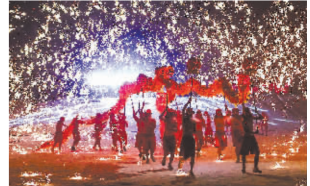
在伏尔加庄园,来自重庆铜梁龙艺术团的36名“龙太子”在铁花中进行舞龙表演,展示千年火龙绝技。

本报讯(记者 朱晓松/文)农历甲辰龙年,龙江龙头高昂。黑龙江是全国唯一一个名字里带“龙”的省份,哈尔滨更蕴藏着许多精彩的“龙元素”。在哈尔滨说龙,不能不提一条“龙”,这就是阿城金上京的铜坐龙,亦动亦静,威武雄姿即使千年之后也是充满美感。作为世界四大冰雪节之一,哈尔滨冰雪节扬名世界,雪龙自然少不了。还有天上飞的巨龙风筝,地上行的冰龙舟,百年老街上的彩灯也被能工巧匠扎成了龙的造型……人们用丰富多彩的形式表达着对吉祥幸福的理解。