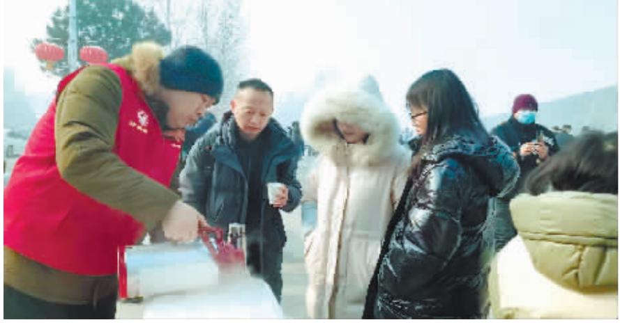
“四叶草”志愿者为排队游客倒热水。

本报(记者 梁可心)“您好,请问喝热水还是红糖姜茶?”“您好,有行李可以先寄存。”……2月10日9时许,侵华日军第七三一部队罪证陈列馆前已出现“红马甲”们忙碌的身影,运热水瓶、倒姜茶、提供引导等服务。截至下午3时,来自四叶草志愿服务中心的“红马甲”们已为游客送出热水1800余杯。