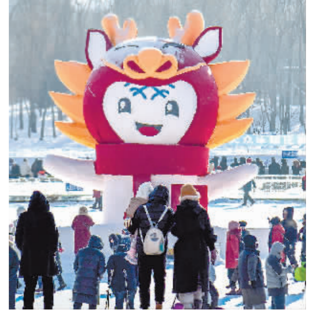
体育公园里造型可爱的“运动龙”。