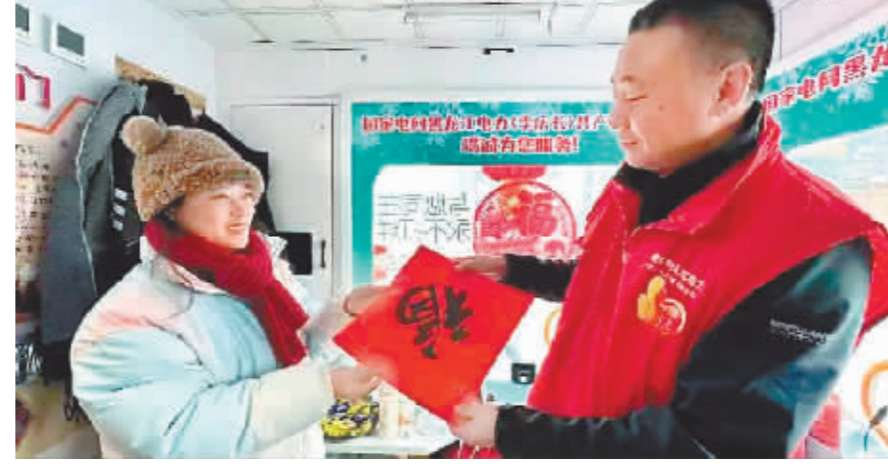
能量小站为游客送“福”。

本报(张铭苒 记者 刘希阳)国家电网黑龙江电力(李庆长)共产党员服务队春节期间值守在建筑艺术广场的能量小站,电力服务“不打烊”,为在哈市过年的游客送去温暖和祝福。