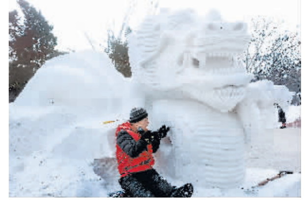
雪雕艺人正在全神贯注地雕刻雪龙。