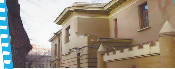
原葡萄牙驻哈尔滨领事馆旧址。