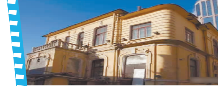
原意大利驻哈尔滨领事馆旧址。