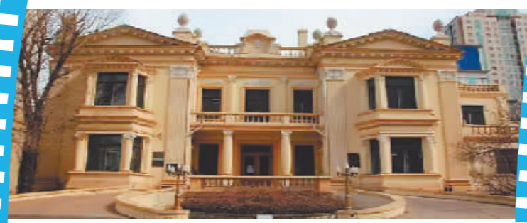
原法国驻哈尔滨总领事馆旧址。

木椅、花池和喷泉。建筑内部能看到墙壁、楼梯、门窗垭口都装饰着大量精美的木质雕刻,堪称奢华。颐园街3号作为法国总领事馆的时间并不长,是哈尔滨现在唯一存留的法国领事馆旧址。