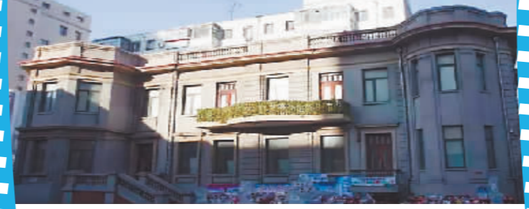
原德国驻哈尔滨总领事馆旧址。