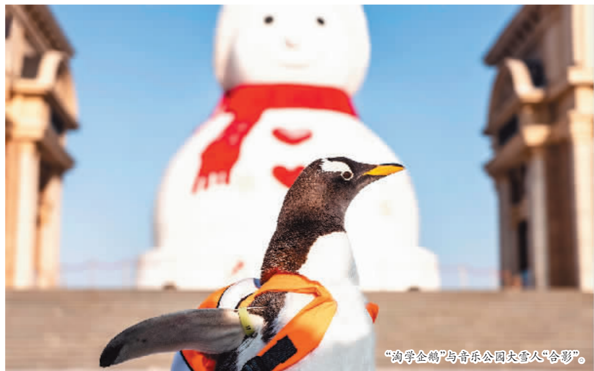
“淘学企鹅”与音乐公园大雪人“合影”。

你好,“尔滨”,我是你的宝贝儿“淘学企鹅”——当一群憨态可掬的南极企鹅被冠以“淘学”二字后,当它们背上小书包开始全城巡游时,它们已经为出圈做好了准备,也注定会为冰城旅游画上浓墨重彩的一笔。