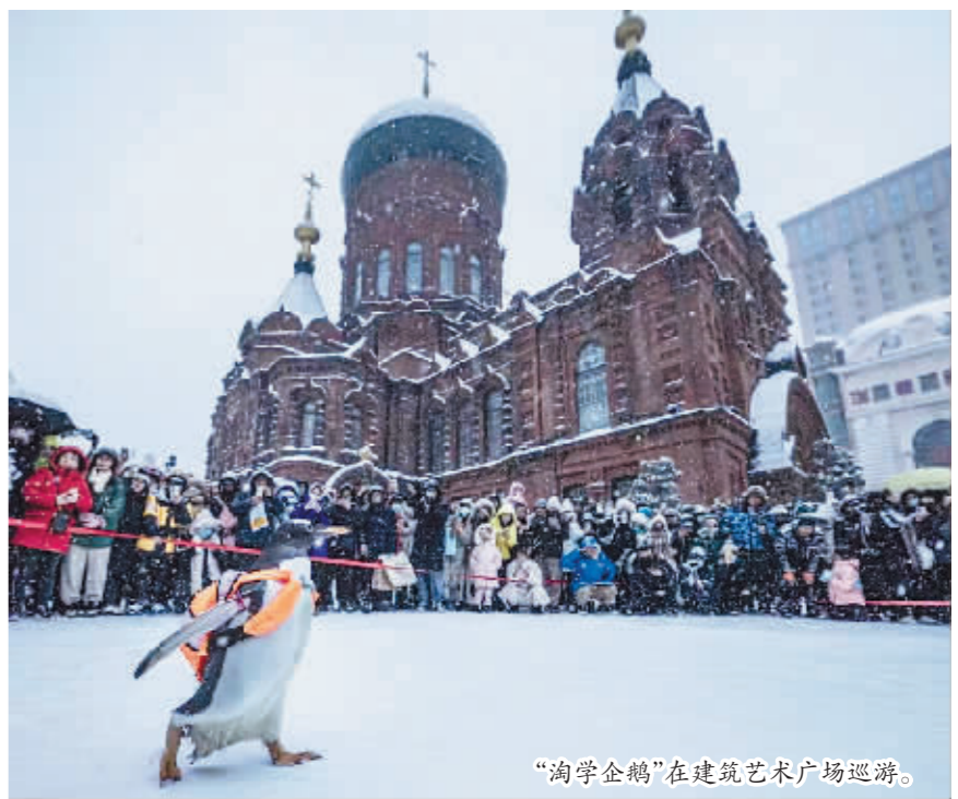
“淘学企鹅”在建筑艺术广场巡游。