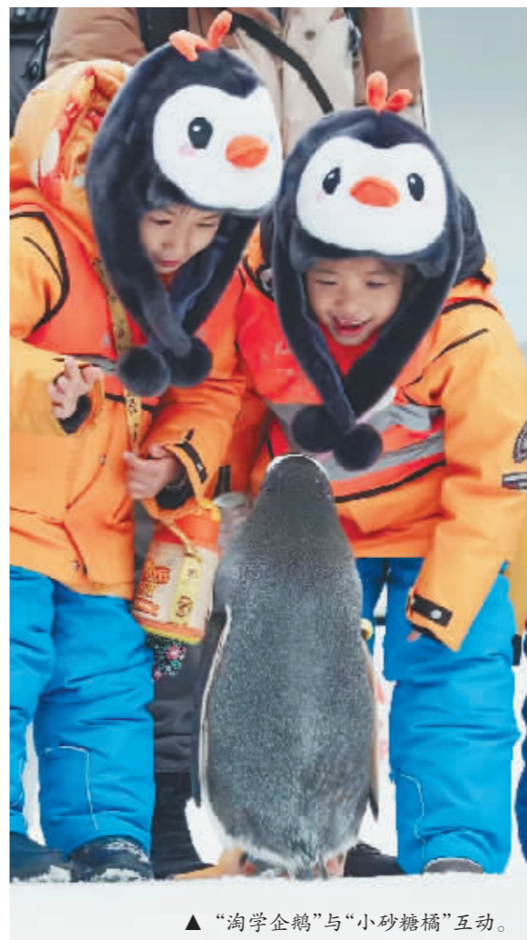
“淘学企鹅”与“小砂糖橘”互动。

“淘学企鹅”成为拉动今冬哈尔滨旅游热潮的城市IP,“淘学企鹅”更是令今冬哈尔滨火爆出圈的功勋萌宠。“到哈尔滨,看企鹅”成为全国游客的打卡愿望。“不是每个人都能去南极看企鹅迁徙,所以我们让南极企鹅从极地公园里走出来,到冰天雪地巡游,南极企鹅一只就价值45万元,极地公园每天都承担着1000万元生物资产风险进行免费‘巡游’,就是为了让全国游客来到哈尔滨,就能看到企鹅!”田力如是说。