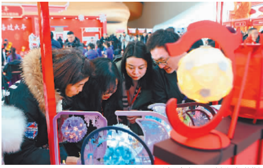
现场陈列的文创产品备受欢迎。

在春节文旅消费月主场活动场外特设的文化旅游消费场景里,琳琅满目的“文化大集”产品让人目不暇接。在“滨滨有礼”展示专区,老鼎丰、何所有、秋林格瓦斯、马迭尔文创雪糕、抚远蔓越莓、冰糖葫芦、地方特产水果……购买和品尝美食的人络绎不绝;陶瓷、文创、方正剪纸、工艺品、纪念品、特色IP玩偶等充满冰城特色的旅游商品