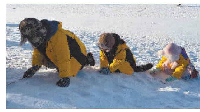
广东小朋友对哈尔滨的雪爱不释手。

本报讯(记者 毕博文/摄)1月25日,广东佛山来哈研学的10名小朋友返回回家,一周的冰城研学期间,孩子们在冰雪里畅玩,对哈尔滨冰雪爱不释手。