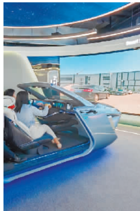
2023年12月5日,参观者在位于广东惠州的德赛西威智慧出行体验馆内体验。