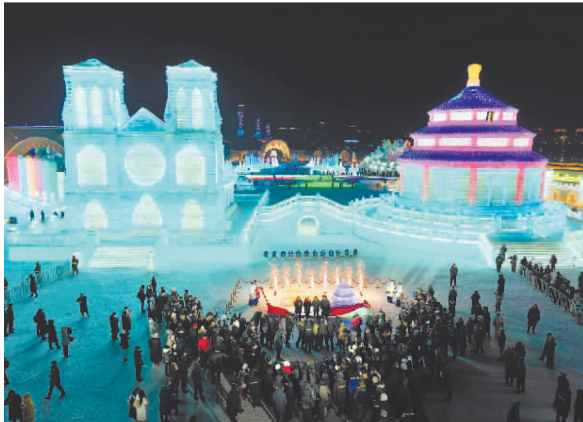
1月5日,嘉宾为北京天坛和巴黎圣母院冰雕揭幕。

母院’和‘北京天坛’已经开始‘对话’了。”米其林中国区总裁兼首席执行官叶菲说,他们将在中国多个城市举办精彩活动,用美食文化为中国民众留下更多美好记忆,推动中法文化的对话和交融。