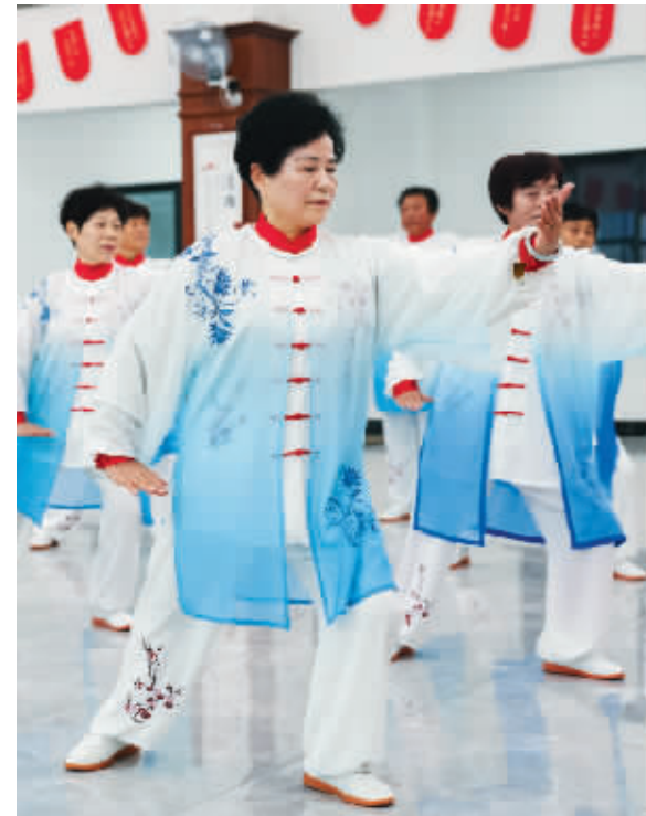
在杭州市临安区老年大学,老人们在练习太极拳。