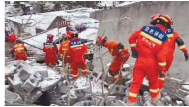
1月22日在云南省昭通市镇雄县塘房镇凉水村拍摄的救援现场(视频截图)。

新华社昆明1月22日电 1月22日6时许,云南昭通市镇雄县塘房镇凉水村发生山体滑坡,造成18户房屋被掩埋,47人失联。解放军和武警部队官兵、民兵闻令而动,迅速投入抢险救援,全力保护人民群众生命财产安全。