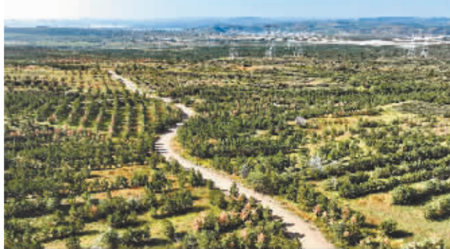
2023年9月10日在内蒙古自治区拍摄的樟子松林。