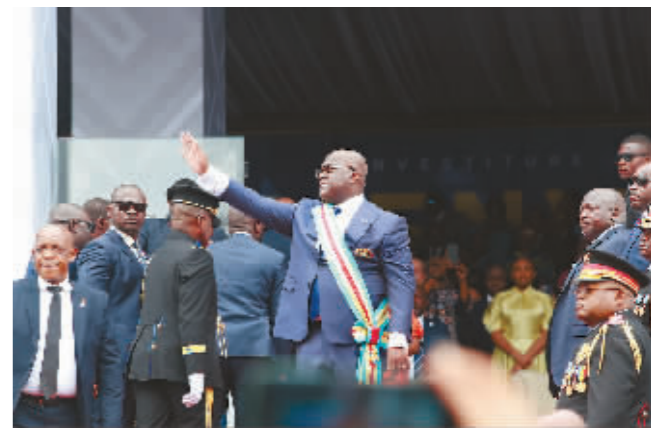
1月20日,刚果(金)当选总统齐塞克迪(中)在首都金沙萨出席就职典礼。刚果(金)当选总统费利克斯·齐塞克迪20日在首都金沙萨宣誓就职,开始为期5年的第二个总统任期。