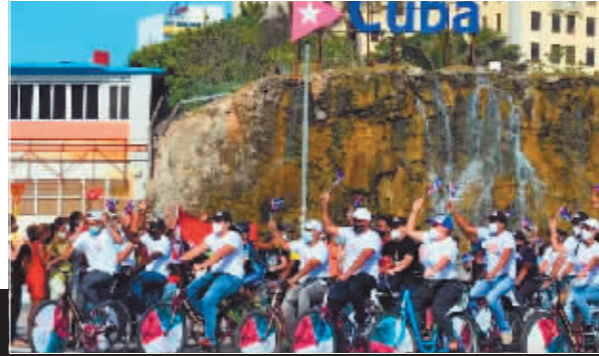
▲2021年8月5日,数百名古巴青年在首都哈瓦那举行保卫国家和平、团结反美游行,要求美国解除对古巴近60年的封锁。