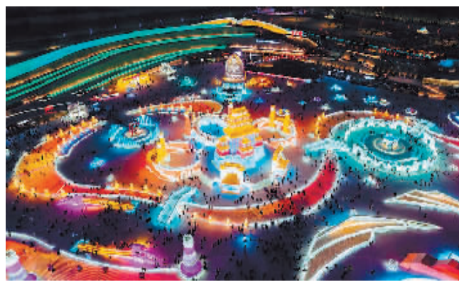
夜晚的冰雪大世界流光溢彩,游客如潮。

本报讯(记者 张鸣雷)第二十五届哈尔滨冰雪大世界应用先进技术,展现科技魅力,借助“5G户外照明管理云平台”,打造多元化、沉浸式的冰雪景观灯光效果,得到八方来客赞誉,增加了景区的魅力。