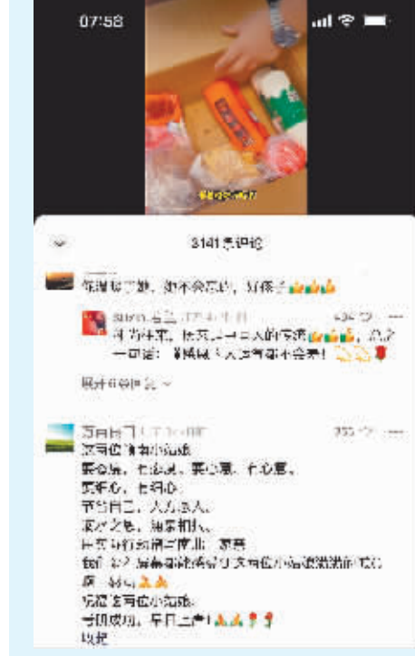
“双向奔赴”的故事引来众多网友点赞。