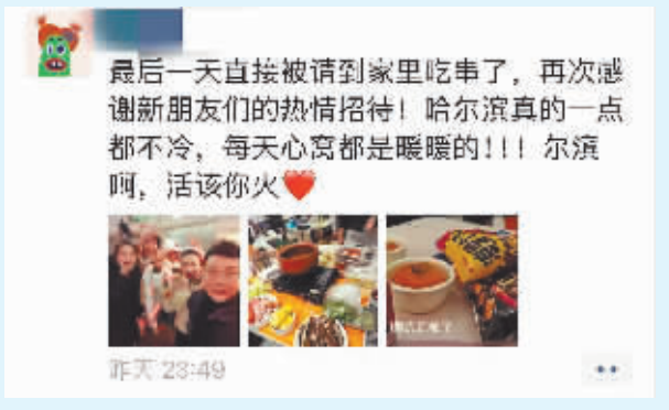
哈尔滨人的热情温暖了江西游客。