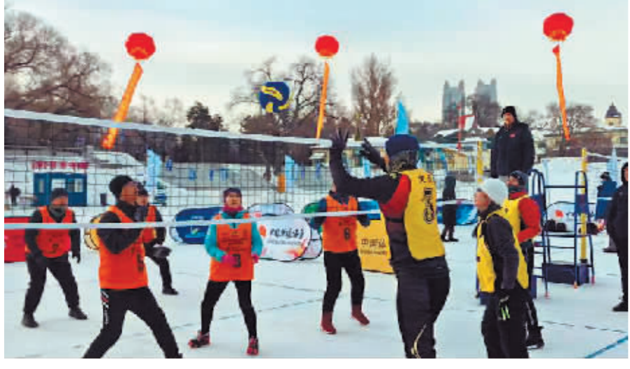
参赛队伍激烈竞争。

本报讯(记者 张堃雷文/摄)1月20日,黑龙江省第四届全民健身运动会雪地气排球比赛在哈尔滨冰雪体育游乐园开赛。来自哈尔滨、佳木斯、大庆、伊春等各地区的10支队伍齐聚冰城,各队通过小组“单循环+交叉淘汰赛”的激烈争夺,牡丹江队获得冠军,佳木斯队和大庆队分获第二名、第三名。