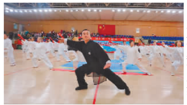
活动现场太极功夫扇表演。

本报讯(记者 张望雷)1月20日,哈尔滨市全民健身运动会暨社区健身活动月在哈尔滨八区体育中心开幕。 活动现场,来自哈尔滨市9个城区的500余名社区群众进行了健身操、太极功夫扇、健身球、花样跳绳、水兵舞、健身球等健身项目的展演。 本次活动由哈尔滨市体育局主办,道外区文化体育和旅游局、哈尔滨飞鱼文化传播有限公司承办,八区体育中心协办,市社会体育指导员协会、市跳绳协会、市太极拳协