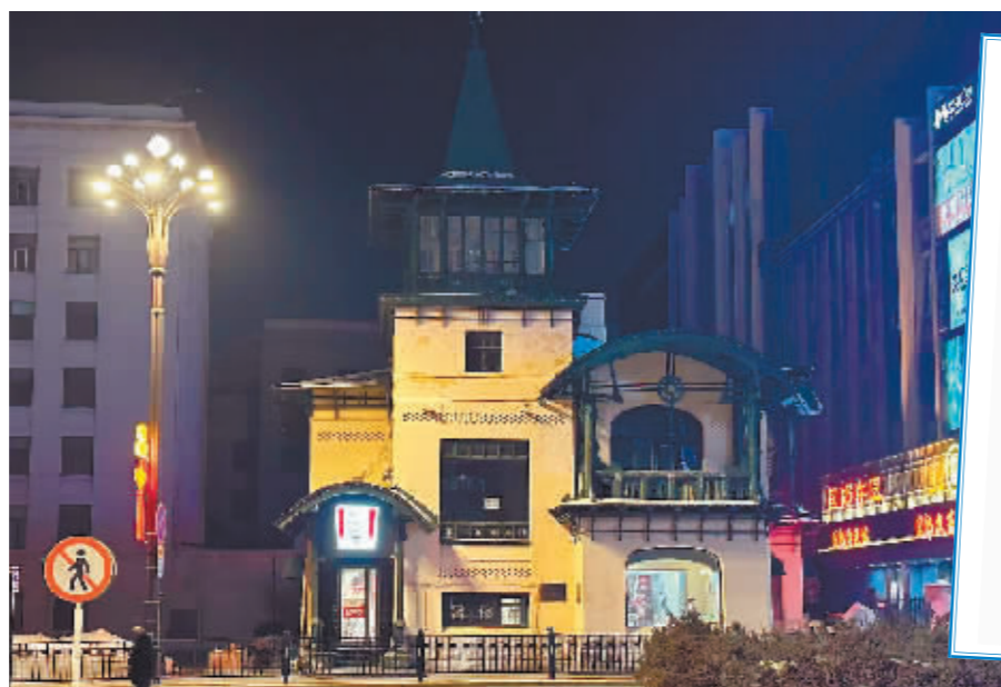
网友拍摄的中东铁路局局长官邸。