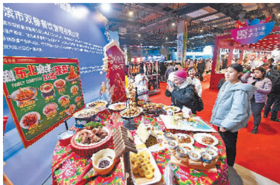
东北特色菜吸引市民、游客目光。