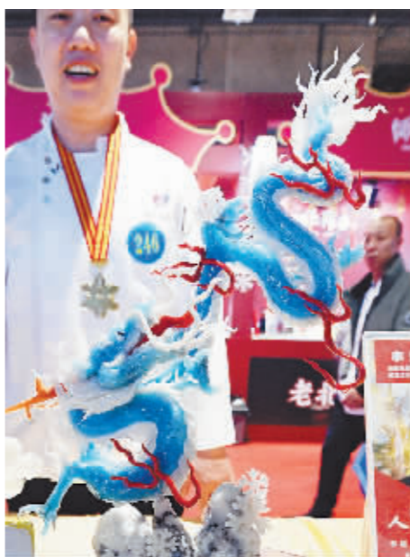
蓝龙雕刻活灵活现。

专门“打飞的”来欣赏的冰雕也搬上展台,一个半米高、手捧巧克力球的卡通小龙晶莹剔透、栩栩如生,头顶的两个龙角十分可爱。工作人员说,这个小冰雕人气特别足,引来很多“小金豆”拍照。