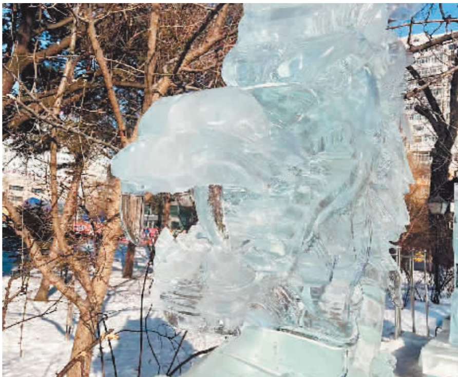
补好龙牙的冰雕作品。

兆麟公园内的哈尔滨冰灯游园会是哈尔滨冰雪艺术的发源地,是哈尔滨一张亮丽的冰雪名片。今年,园方对冰雕的修补非常及时,技术水准也达到历年最高水平,只为让本届冰灯游园会的观赏期更长一些。