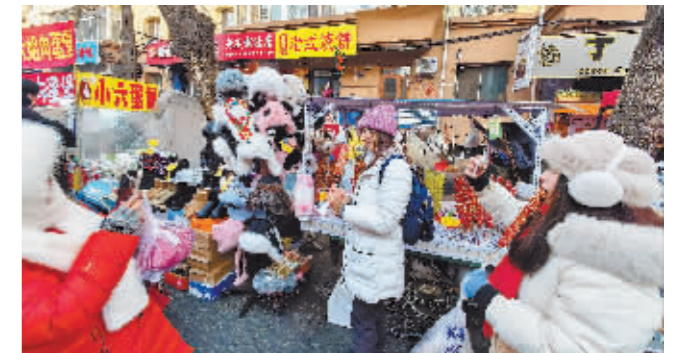
游客在红专街早市“逛吃”。

本报(记者 刘妹媛)现正值冬季旅游旺季,为了更好地服务外地游客,满足游客需求,春节期间,道里区摊区办、属地办事处及管理企业全员上岗,切实抓好道里区市场摊区节日期间各项工作。节日期间,道里区12个市场摊区正常营业。