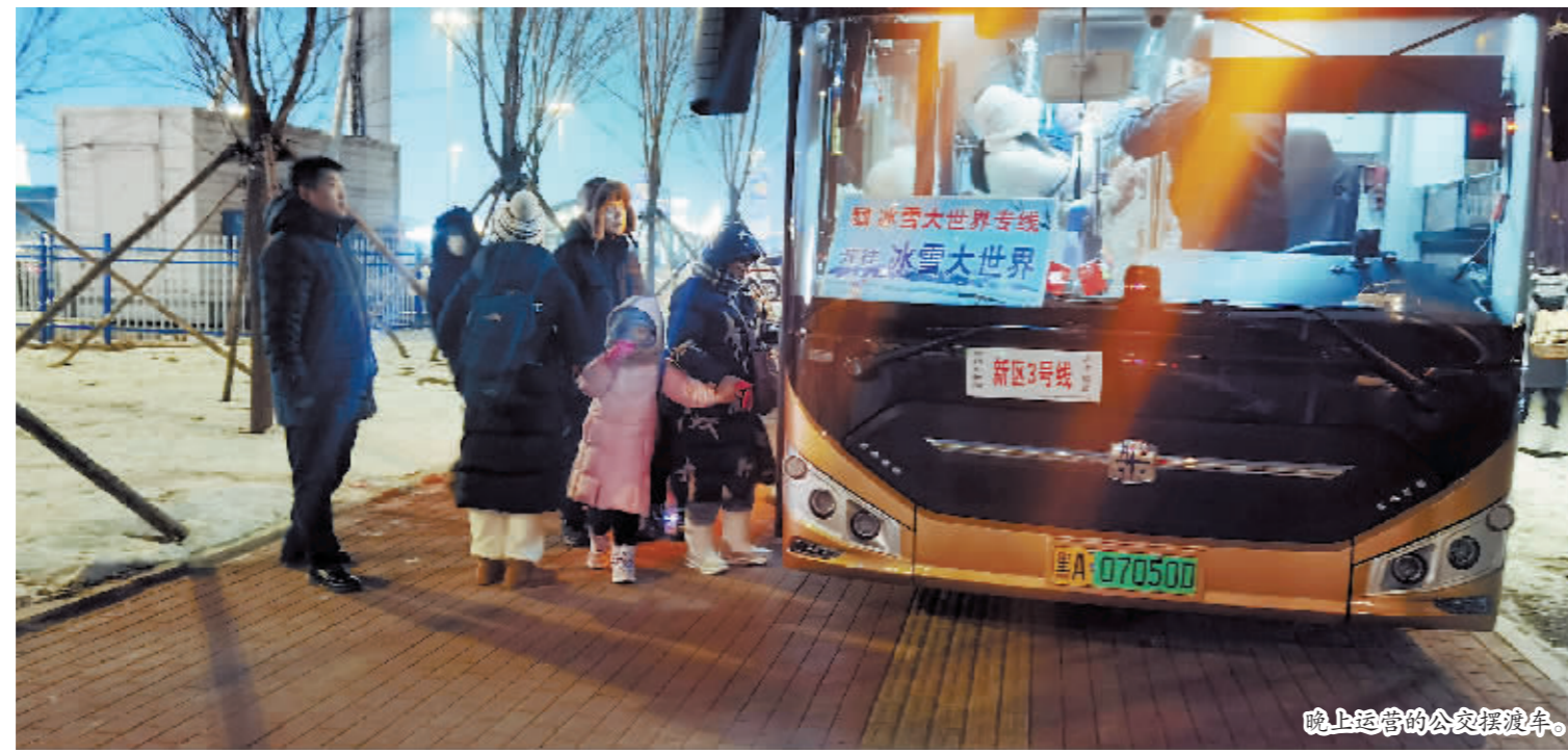
晚上运营的公交摆渡车。

小紧张,还有点小兴奋。紧张是要把车开得更平稳、安全,怕有瑕疵影响哈尔滨形象;兴奋是自己也是“且”的一员,近距离经历着哈尔滨的“被看见”。