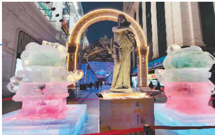
“滨滨”和“妮妮”迎接各地游客。

本报讯(柏凡露 记者 梁可心)为营造浓厚的冰雪季氛围,喜迎2025年第九届亚冬会,近日,亚冬会吉祥物“滨滨”和“妮妮”冰雕,与可爱的“大雪人”雪雕,同时出现在南岗区建设街步行街,为南岗区老秋林商圈注入冰雪新元素,注入旅游打卡新活力。