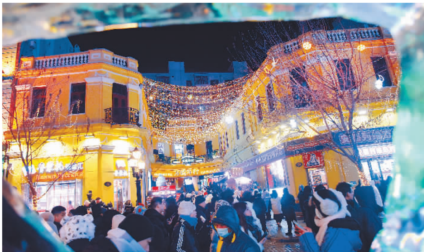
夜幕下的“万国洋行”灯火璀璨。

中央大街现有各类历史建筑62栋,为了方便游客了解每一个建筑的特点和历史故事,中央大街管委办设置二维码,市民、游客扫码即可听建筑、看建筑、读建筑,即使没有讲解员也可以探寻老建筑的“前世今生”。