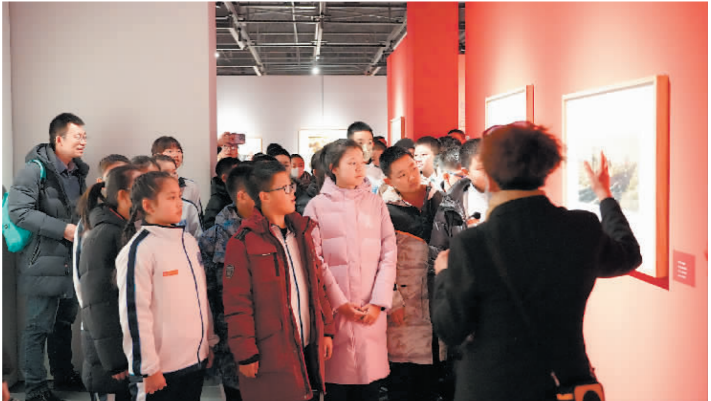
黑龙江(国际)版画馆吸引了各个年龄层的参观者。

在全国围观“尔滨”层出不穷的“花式宠游客”时，学生宝宝们已经去排队看版画界的《人世间》了。刚开馆14个月的黑龙江(国际)版画博物馆是名副其实的“宝藏馆”，它是全国唯一一家省级版画馆。藏品1.3万件(套)，版画是全国最多的。国内外名家作品、获奖作品应有尽有。五层展厅，让你看遍世界经典版画。