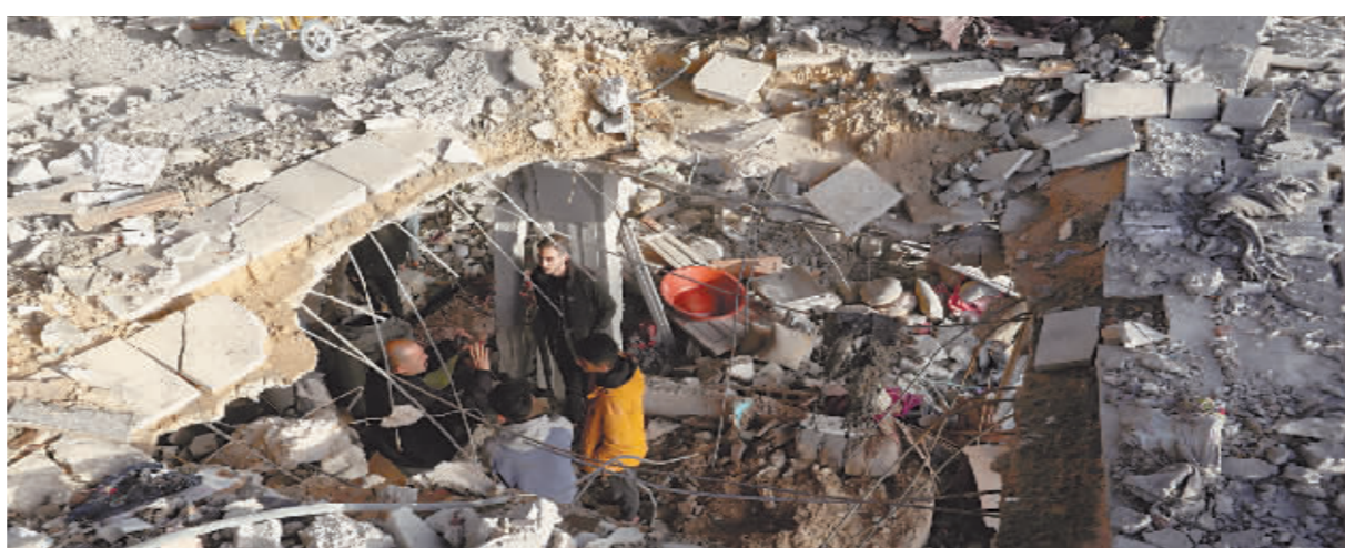
1月10日,在加沙地带南部城市拉法,人们查看遭袭击损毁的建筑。

此外,以色列正为被扣押的以方人员积极斡旋,以帮助他们获得所需药品。以色列总理办公室12日发表声明