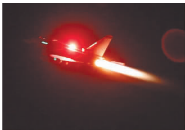
1月11日,英国皇家空军战机从塞浦路斯起飞对也门进行空袭。