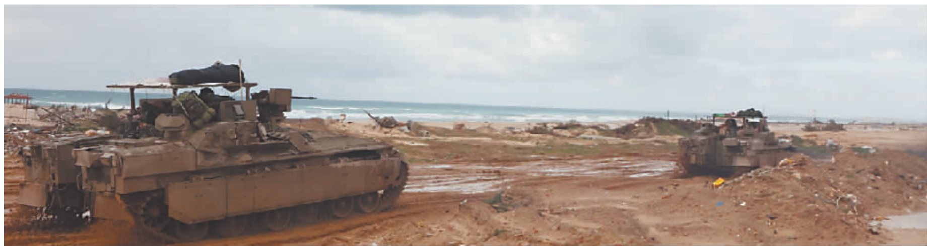
1月11日,以军部队在加沙地带展开行动。

新华社北京1月13日电 联合国人道主义事务协调厅官员安德烈亚·德多梅尼科12日指责以色列“系统性”阻挠向巴勒斯坦加沙地带北部运送物资的人道主义援助。