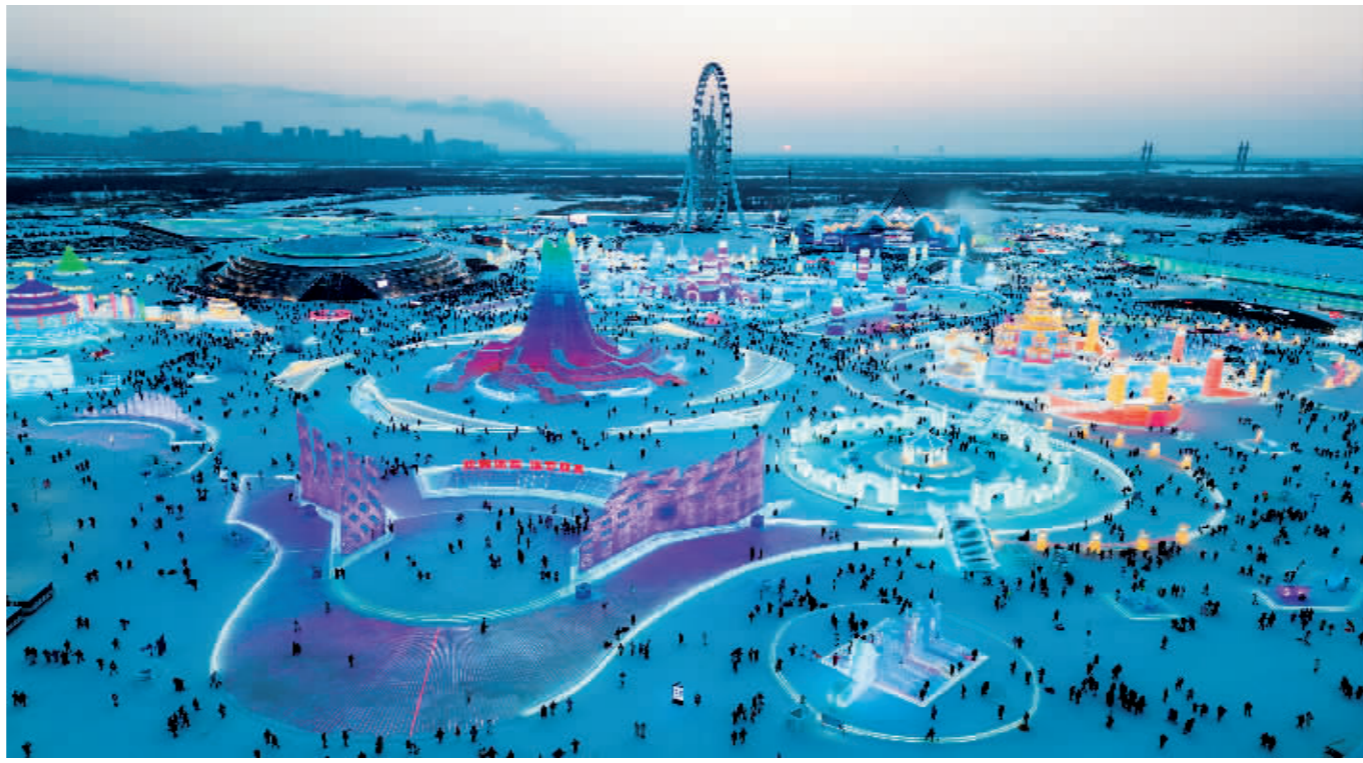
第40届中国·哈尔滨国际冰雪节开幕,吸引众多游客。

今冬的东北有些不一样。先是沈阳凭着“不是欧洲去不起,沈阳更有性价比”爆火出圈,后有“尔滨”真诚待客一炮走红。南方游客赶大集一样涌来,嬉冰雪、逛早市、泡温泉;东北“老铁”应声而动,搭建“暖棚”、免费送站、悉心服务。宾客与主人间的高调互动,在数九寒天