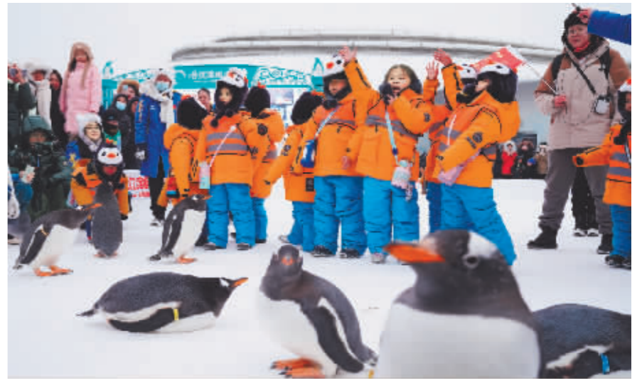
在哈尔滨极地公园,来自广西南宁的“小砂糖橘”与企鹅互动。

从“小土豆”到“小砂糖橘”,从“小野生菌”到“小豫米”,当越来越多外地游客涌向白山黑水,他们发现东北人真的很“拼”。