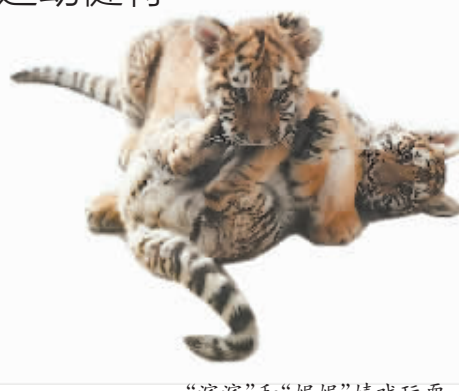
“滨滨”和“妮妮”嬉戏玩耍。

“滨滨”和“妮妮”虽然现在体长只有60厘米左右,体重约20斤,但等到亚冬会开幕,它们也将长大初露“虎威”。虎不仅是吉祥的象征,长大后的“滨滨”和“妮妮”更代表着力量和勇气,与奥林匹克运动精神高度契合。