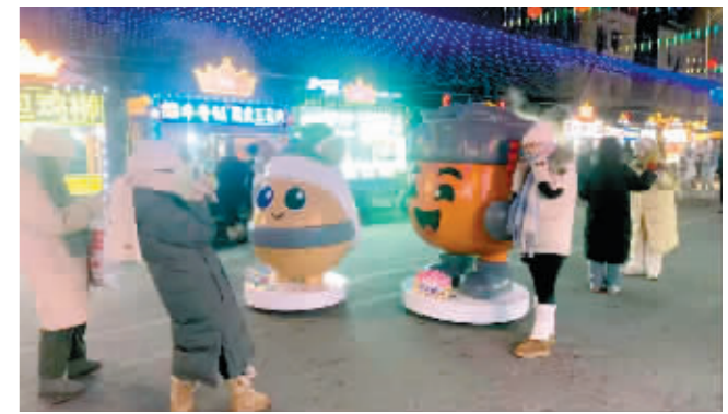
师大夜市新增的卡通摆件受到游客欢迎。

本报(记者 霍亮)为了满足广大游客打卡拍照需求,日前,师大夜市又上新一批可爱的卡通摆件景观。师大夜市营业时间为17时至22时,广大游客和市民冬季逛夜市可提前安排好出行时间。