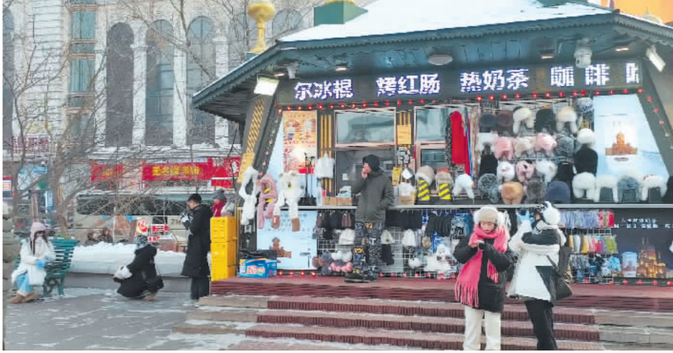
景区小店琳琅满目的特色商品让游人目不暇接。

生意越来越好,服务越来越细,让本地人直呼“像极了小时候家里来亲戚,我妈不仅拿出了所有好东西,回头还不忘跟我说句‘你得礼貌点’”。记者连日走访,见证了冰城商家高举高打的“针对性服务”。