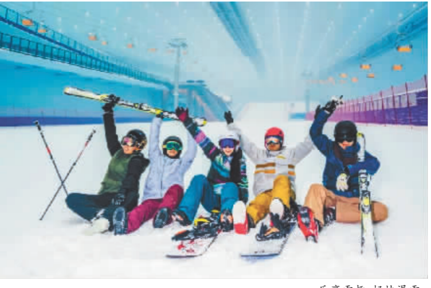
乐享雪趣,畅快滑雪。

能够极大激发孩子的求知欲,让孩子在动手参与的过程中体验到科学的乐趣。 地址:松北区太阳大道1458号