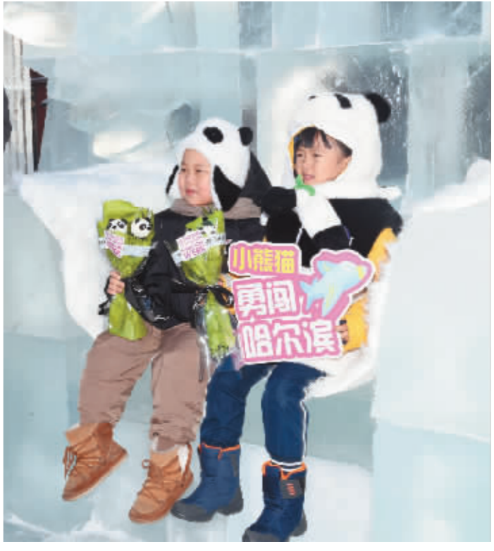
“小橙子”和“小熊猫”坐上“冰雪女王座”。