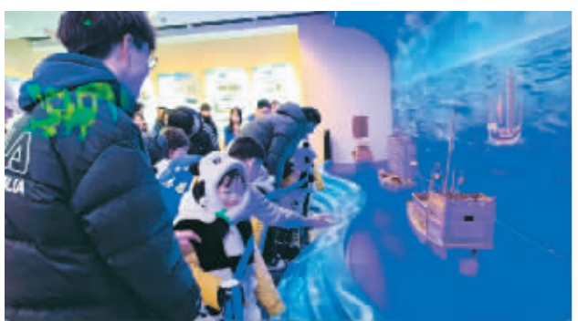
“小熊猫”们到哈工程大学船舶博物馆学习船舶知识。

据了解,这座冰雕将于11日正式揭幕,将成为这个爆火冰雪季哈西地区的独特景观。市民、游客不仅可以坐上“女王座”当回“女王”,还可在设置的主题合影框打卡拍照。