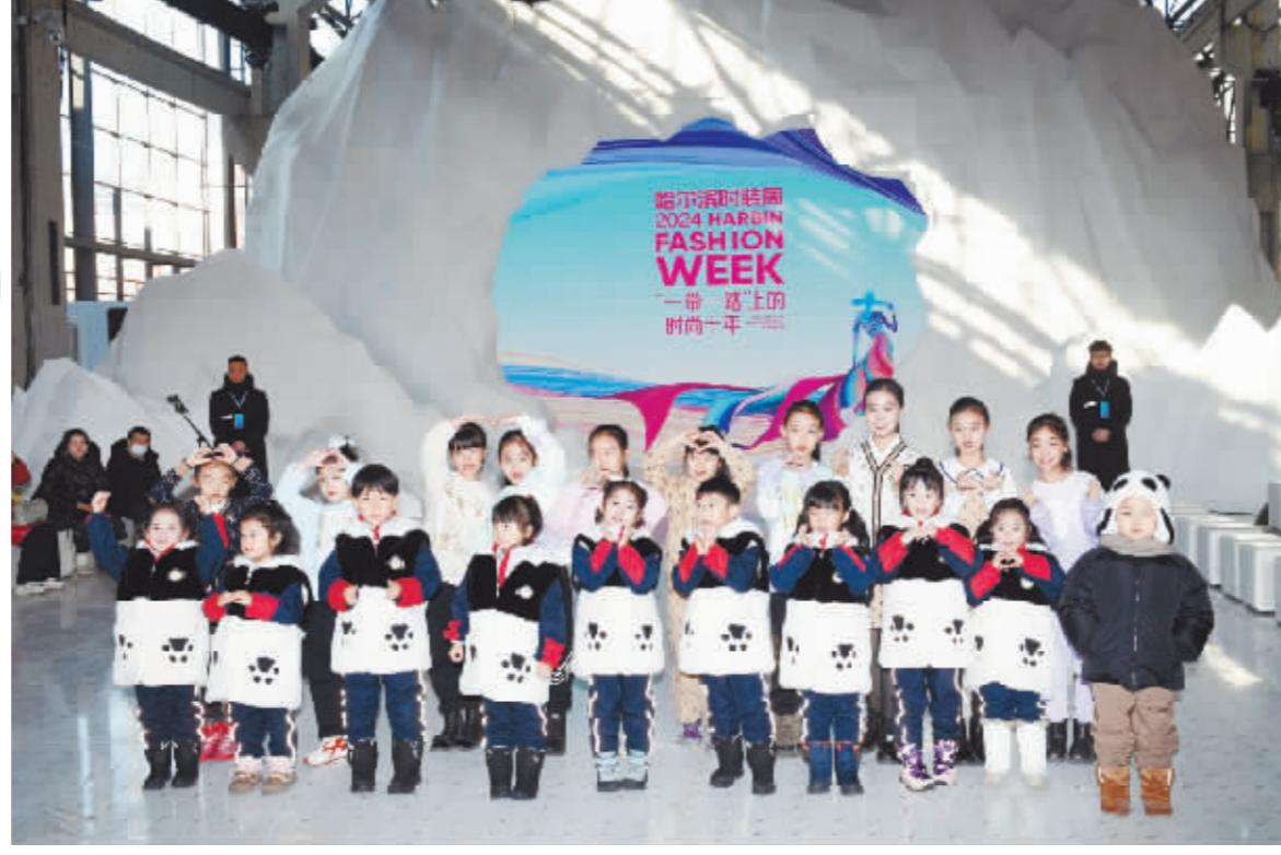
哈尔滨小模特和“小熊猫”们一起合影。

1月10日上午,当一群来自四川成都的萌萌哒“小熊猫”团队,出现在南岗区“冰雪女王座”冰景前时,瞬间成为一条街最靓的仔,他们身穿毛茸茸的熊猫坎肩、头戴熊猫帽子,随身行李上也印有漂亮的熊猫头像,比行李箱高一点点的他们,走起路来蹦蹦跳跳,十分可爱,他们带着丰富的学习任务开始了在南岗区的游学之旅。