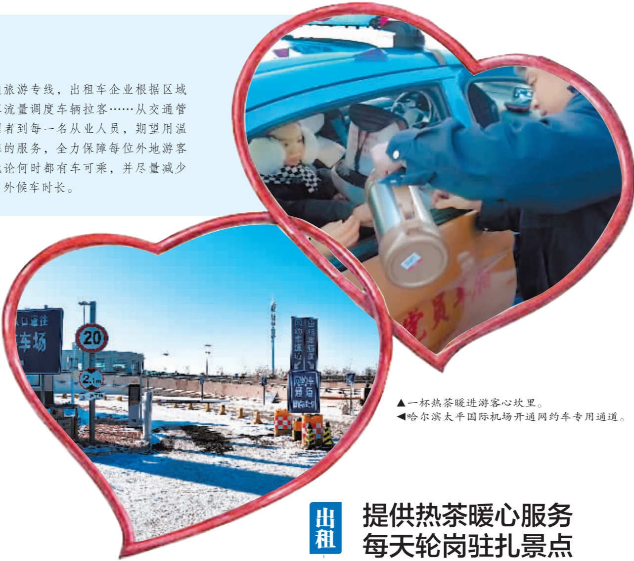
▲一杯热茶暖进游客心坎里。 ▲哈尔滨太平国际机场开通网约车专用通道。

通旅游专线,出租车企业根据区域客流量调度车辆拉客……从交通管理者到每一名从业人员,期望用温馨的服务,全力保障每位外地游客无论何时都有车可乘,并尽量减少户外候车时长。