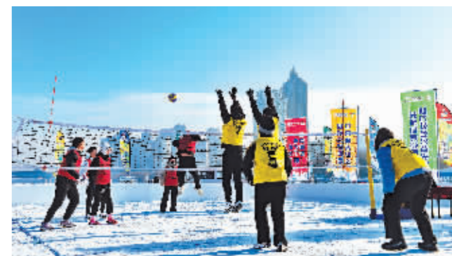
排球爱好者在雪地上比拼球技。

本报讯(记者 张堃雷文/摄)日前,由中国排球协会、黑龙江省体育局和哈尔滨市体育局倡导,省当代艺术研究院支持,省排球协会与哈尔滨松花江冰雪体育乐园共同建设的两块雪地排球场地在哈尔滨松花江冰雪体育乐园(道里区通江街附近江面)竣工并对外开放。作为全国首个免费雪地排球场地,场地的开门纳客为前来哈尔滨观光旅游的游客以及本地的排球爱好者,提供了参与雪地排球项目、享受其乐趣的新平台。