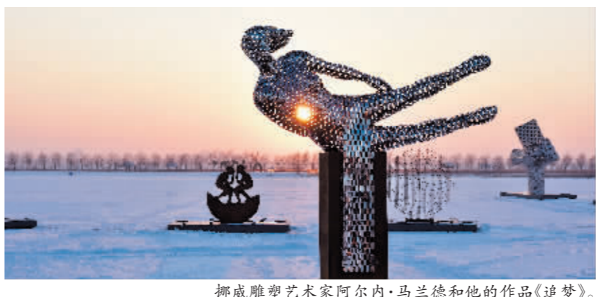
挪威雕塑艺术家阿尔内·马兰德和他的作品《追梦》。

雕塑是看似柔软实则坚硬的艺术。《追梦》高约两米,重0.5吨,虽然是青铜材质,但屹立在呼兰河的冰面上,映着夕阳却多了几分柔美与感性。作为开幕式上的“重头戏”,阿尔内·马兰德向