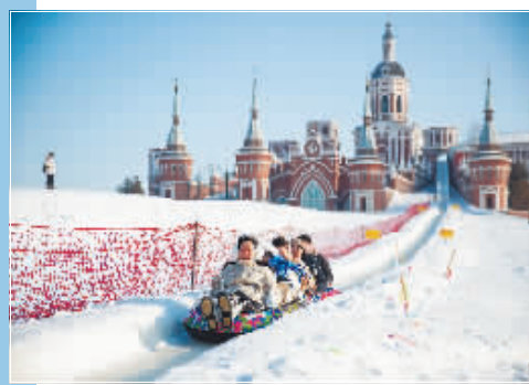
游客在景区内游玩。