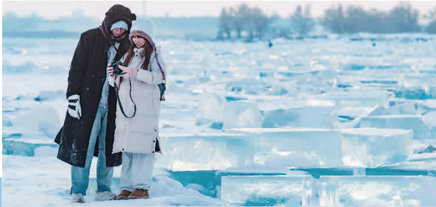
1月7日,在封冻的松花江哈尔滨段,游客在“钻石海”游玩。