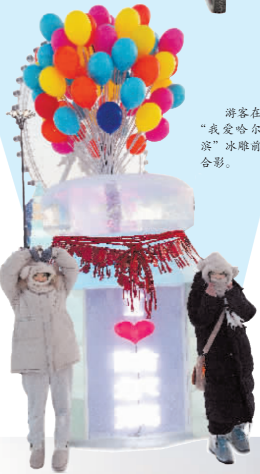
游客在“我爱哈尔滨”冰雕前合影。

2023年7月8日,在泰国曼谷举行的第42届亚奥理事会全体大会上,哈尔滨成功获得2025年第九届亚冬会举办权,“奥运冠军之城”哈尔滨成为第二个举办两届亚冬会的城市。多年来,通过专业冰雪赛事和群众冰雪运动的双核发展,哈尔滨努力将冰雪运动向全国辐射拓展,成为“带动三亿人参与冰雪运动”的核心区,在为冰雪运动发展作出突出贡献的同时,也助推着冰雪经济全产业链的发展。2023上海合作组织雪地自行车赛、第四届芬澜滑雪越野滑雪马拉松赛、全国男子冰球锦标赛等重大品牌体育赛事活动的举办,有效带动了商场、酒店、宾馆、旅游等服务业的发展,充分激发了冰雪市场的消费活力。