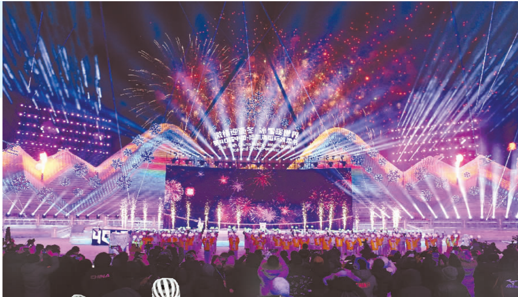
冰雪大世界灯光璀璨,礼花漫天。

冰雪节庆是哈尔滨人对大自然赐予的寒冷的尊重。1985年1月5日,以冰灯游园会为基础创办的哈尔滨冰雪节在兆麟公园南门外隆重开幕。经过40年的发展,如今的哈尔滨冰雪节已经成为与日本札幌雪节、加拿大魁北克冬季狂欢节和挪威奥斯陆滑雪节并称为世界四大冰雪节的国际性节日。作为世界上活动时间最长的冰雪节,哈尔滨用最冷的冰雪主题,打造出最热的城市舞台,用既冷艳迷人又热情如火的城市气质,把冰雪打造成我国冬季旅游走向世界的亮丽名片。