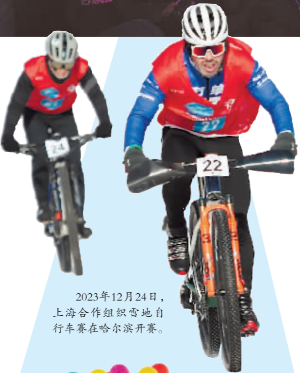
2023年12月24日,上海合作组织雪地自行车赛在哈尔滨开赛。

仅2024年元旦假期,哈尔滨就接待游客304.79万人次,同比增长441.4%;实现旅游总收入59.14亿元,同比增长791.92%,游客接待量与旅游总收入达到历史峰值。哈尔滨冰雪旅游的爆火,进一步拉动着冰雪文化、冰雪运动、冰雪装备等冰雪产业的融合发展。在一系列“冰雪+”产品的消费增长中,哈尔滨发展冰雪经济的优势与潜力持续得到释放。