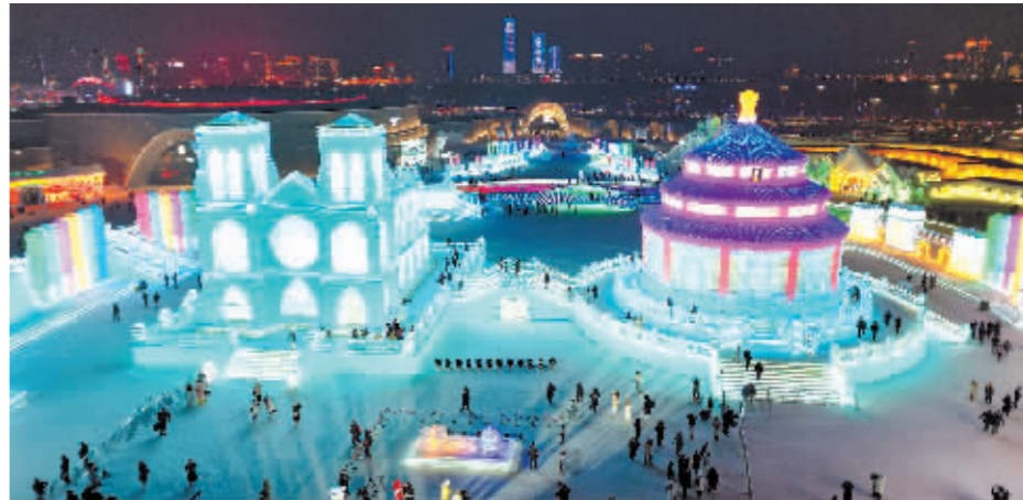
第40届中国·哈尔滨国际冰雪节暨法中文化旅游年开幕。