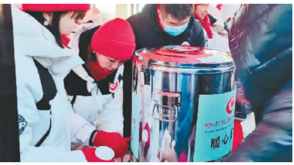
志愿服务队发放饮品。

自己的担当。哈尔滨市中医医院充分发挥中医药特色优势,在传承创新中医药文化的基础上,根据季节变化精心研制了四季代茶饮,每日为门诊患者免费提供饮用。活动中为大家准备的是具有健脾益气、温中散寒功效的冬季代茶饮,希望为游客朋友们在寒冷的冬天送去一份温暖。哈尔滨热情好客,哈尔滨市中医医院就是城市的温度传递者,我们为城市形象代言,我们用实际行动延续“遇见冰雪遇见暖,不负美景不负情”的倡导和承诺。短短2个小时,4桶热气腾腾的代茶饮,温暖了2000余位游客,扮靓了中央大街,丰富了冰雪文化,贡献了中医力量。