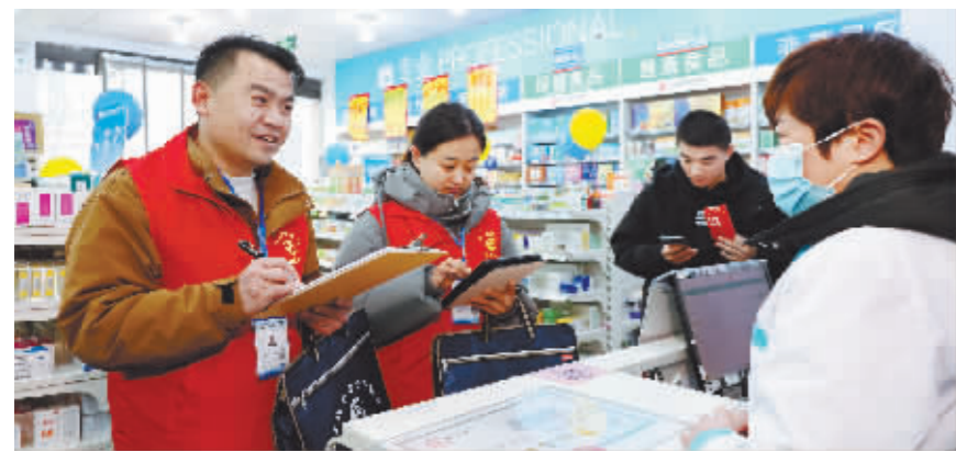
1月1日，山东省枣庄市市中区光明路街道普查员在一家连锁药店登记普查信息。

新华社北京1月1日电 第五次全国经济普查登记工作于1月1日正式启动。全国约210万名普查指导员和普查员，将深入企业商户、走访大街小巷，在近4个月的时间里，实现对116万个普查小区的数据采集登记。 第五次全国经济普查是党的二十大胜利召开后对国民经济进行的一次“全面体检”和“集中盘点”。 国务院第五次全国经济普查领导小组副组长、国家统计局局长康义表示，此次普查将全面调查我国第二产业和第三产业的发展规模、布局和效益，摸清各类单位的基本情况，首次统筹开展投入产出调查，掌握国民经济行业间经济联系，客观反映推动高质量发展、构建新发展格局、建设现代化经济体系、深化供给侧结构性改革以及创新驱动发展、区域协调发展、生态文明建设、高水平对外开