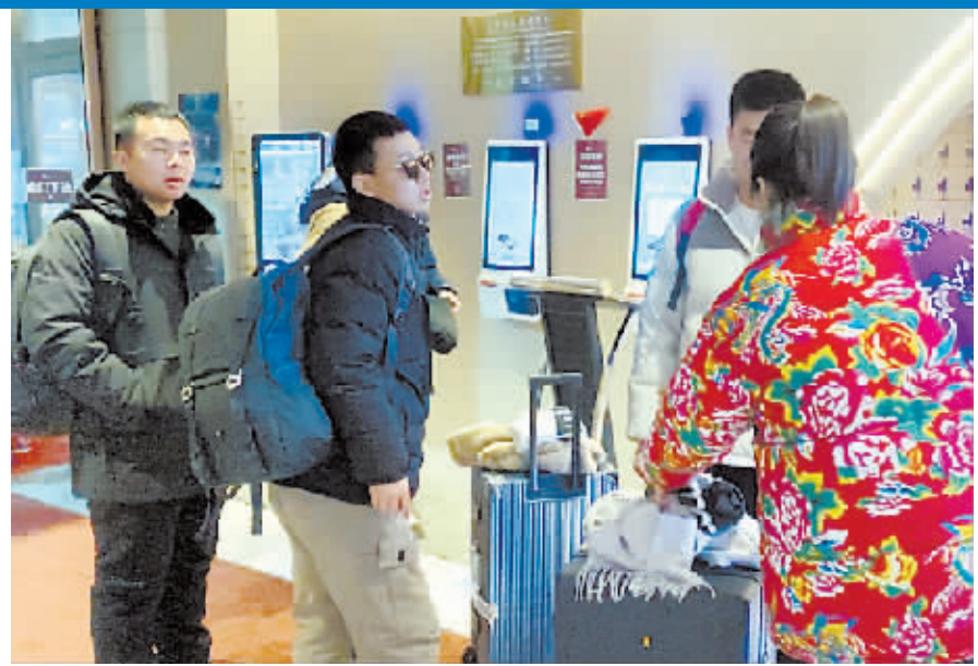
身穿东北特色服装的服务员接待南方游客。

浴中心拥挤程度堪比春运,为接住这“泼天富贵”,商家也是各出“奇招”,这波“服务升级”令冰城旅游热度一升再升。