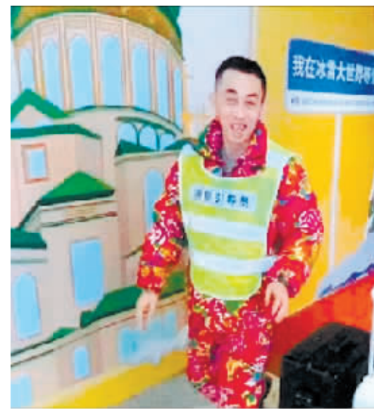
洗浴中心迎宾员热情迎客。

从升级服务到提高核心竞争力,今冬,哈尔滨规模较大的洗浴中心纷纷出招儿揽客,洗浴这项传统服务也在这波流量中焕发出新生机。愈发年轻的消费客群、游客一站式服务体验、越来越广泛的消费认同,都在助力冰城洗浴中心稳定经营。有消费者在接受采访时表示,期待哈尔滨的商家能够提供更多又好又省的潮流洗浴服务,明年一定再来。