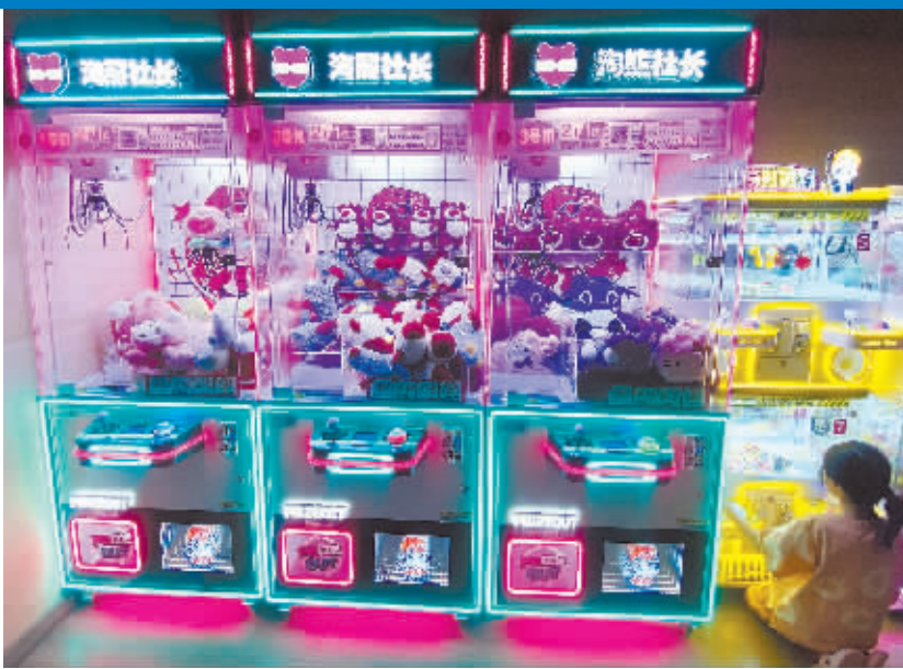
洗浴中心大厅里还设有娱乐设施。