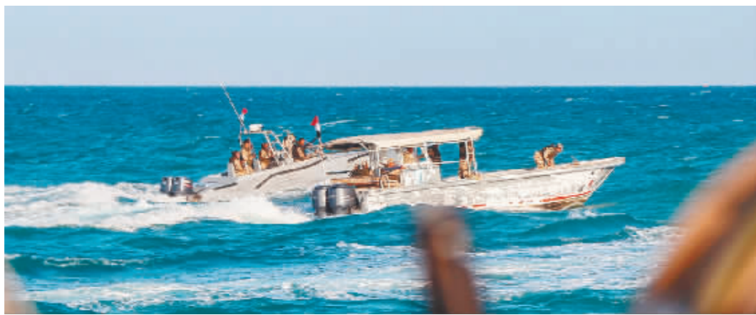
12月12日,也门海岸警卫队在红海南部的曼德海峡附近巡逻。

等国。美国国防部发言人帕特里克·赖德21日表示,截至当日已有20多个国家同意加入。另据媒体报,美军“艾森豪威尔”号航母战斗群已从波斯湾转移到亚丁湾,靠近胡塞武装活