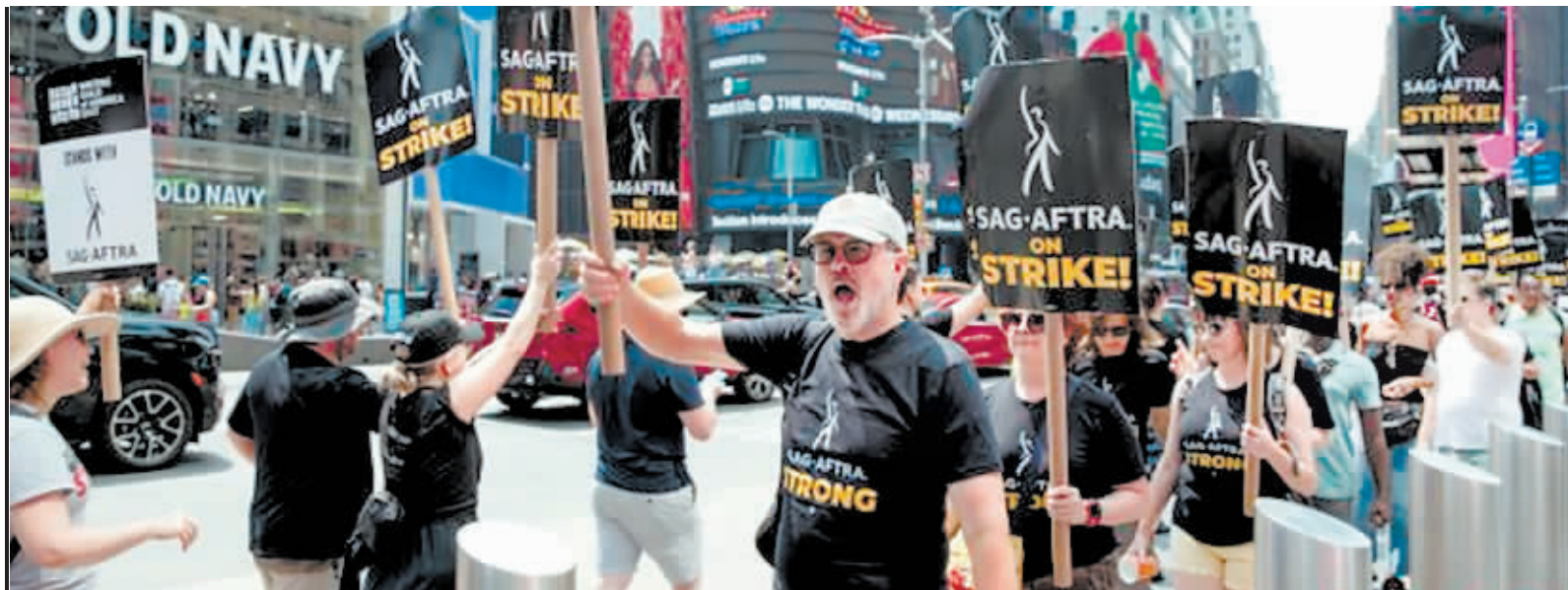
当地时间7月17日,美国纽约时报广场派拉蒙影业公司门前,人们高举“罢工”标语牌游行示威。

美国本轮罢工潮的导火索是居高不下的通货膨胀和日益加大的贫富差距,各行业的罢工诉求主要集中在提高收入、改善待遇和保障就业。广泛性的罢工将推动薪资成本上行,增加企业生产成本,带来裁员效应并进一步推高商品定价。此外,人们对工会组织的认同感加强。这些或将对未来经济和政治产生深远影响。