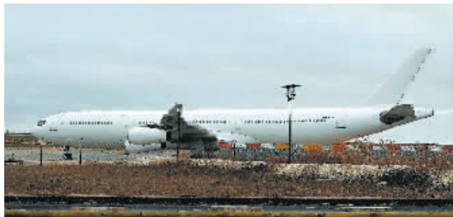
在法国瓦特里机场拍摄的被扣留的飞机。

据新华社电 一架客机因搭载涉嫌偷渡的印度乘客21日经停法国机场加油时被扣留。法国检方23日说,调查人员已核查乘客和机组人员身份,正核实他们出行的“条件和目的”。两名乘客已被拘留,调查人员将查明他们在本次出行中扮演的角色。 这架空中客车A340型客机属于罗马尼亚传奇航空公司,原定21日由阿拉伯联合酋长国的富查伊拉飞往尼加拉瓜首都马那瓜。飞机在法国瓦特里机场加油时,法方接到匿名举报,获悉客机上可能载有偷渡者,便截停飞机并展开调查。 依据法国民事保护部门说法,机上303名乘客中,年龄最小的仅21个月大。路透社以接近检方的人士为消息源报道,有关方面已安排专人临时照顾乘客中11名没有大人陪伴的未成年人。 法国相关法院定于24日举行听证会。据新华社报道,法官有权延长边境警察拘留上述两名乘客的期限。 法新社援引消息人士的话报道,机上10名乘客已申请庇护,另有6名未成年人也表达申请庇护的意愿。机上部分乘客可能是在阿联酋打工者,这些打工者被怀疑试图取道尼加拉瓜前往美国或加拿大。