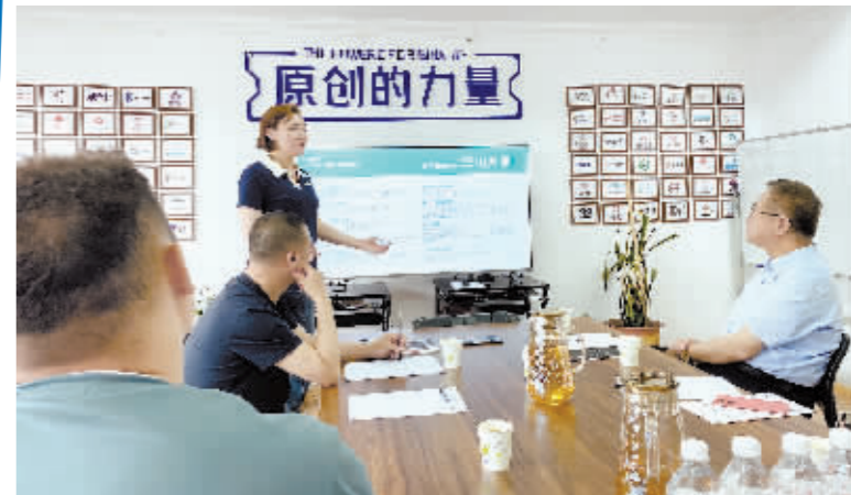
为企业注入创意思维。

品牌设计和创新已逐渐成为企业发展道路上不可或缺的需求,而哈尔滨从不缺少创意基因。今年夏天,哈尔滨创意设计中心在冰城落户,目前已入驻29家设计机构,其中10家设计机构来自省内。