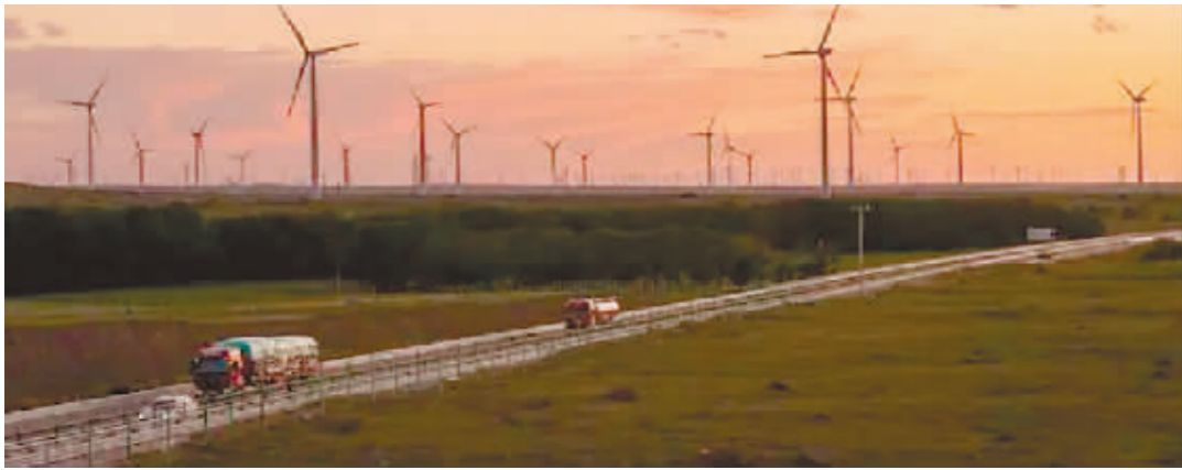
在河北省张家口市张北县境内拍摄的风力发电机。