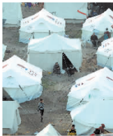
在加沙地带南部城市拉法,人们在临时避难所休息。