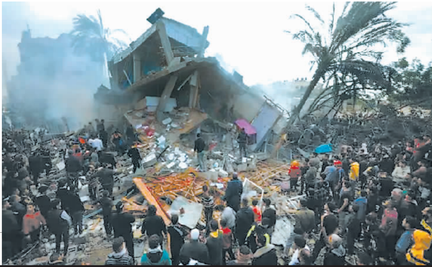
在加沙地带南部城市拉法,人们在以军空袭后的建筑废墟上开展救援。

哈马斯10月7日突袭以色列境内军民目标致以方约1200人丧生,另把200余人挟持至加沙地带。以色列政府随后宣布进入战争状态,对加沙地带发起大规模军事行动,现已导致巴方近2万人死亡、5万余人受伤。