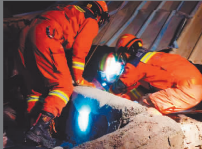
在积石山县大河家镇康吊村二社,消防救援人员对两名被困人员进行救援。