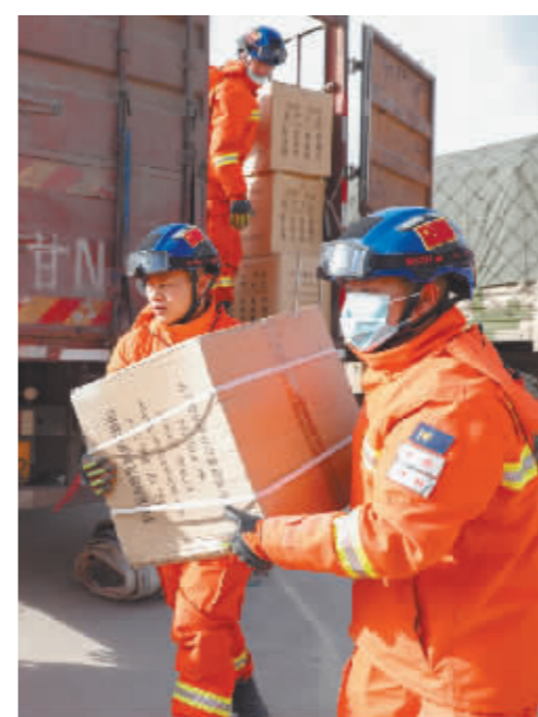
12月19日,在甘肃临夏积石山县大河家镇大河村安置点,消防人员在搬运救援物资。