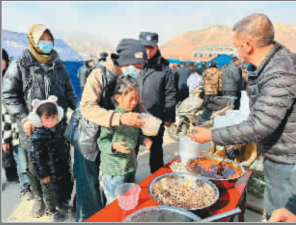
在积石山县大河家镇大河村安置点,受灾群众排队取餐。