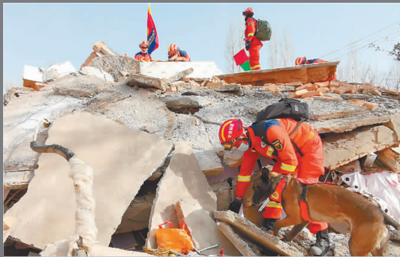
救援人员在甘肃省临夏州积石山县大河家镇进行救援。

同时,甘肃、青海两省应急管理部门已向灾区调拨大量米面粮油、取暖炉、棉被等地方各级救灾物资,全力做好受灾群众基本生活保障工作。