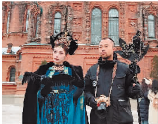
大伟哥(右)与旅拍人物合影。