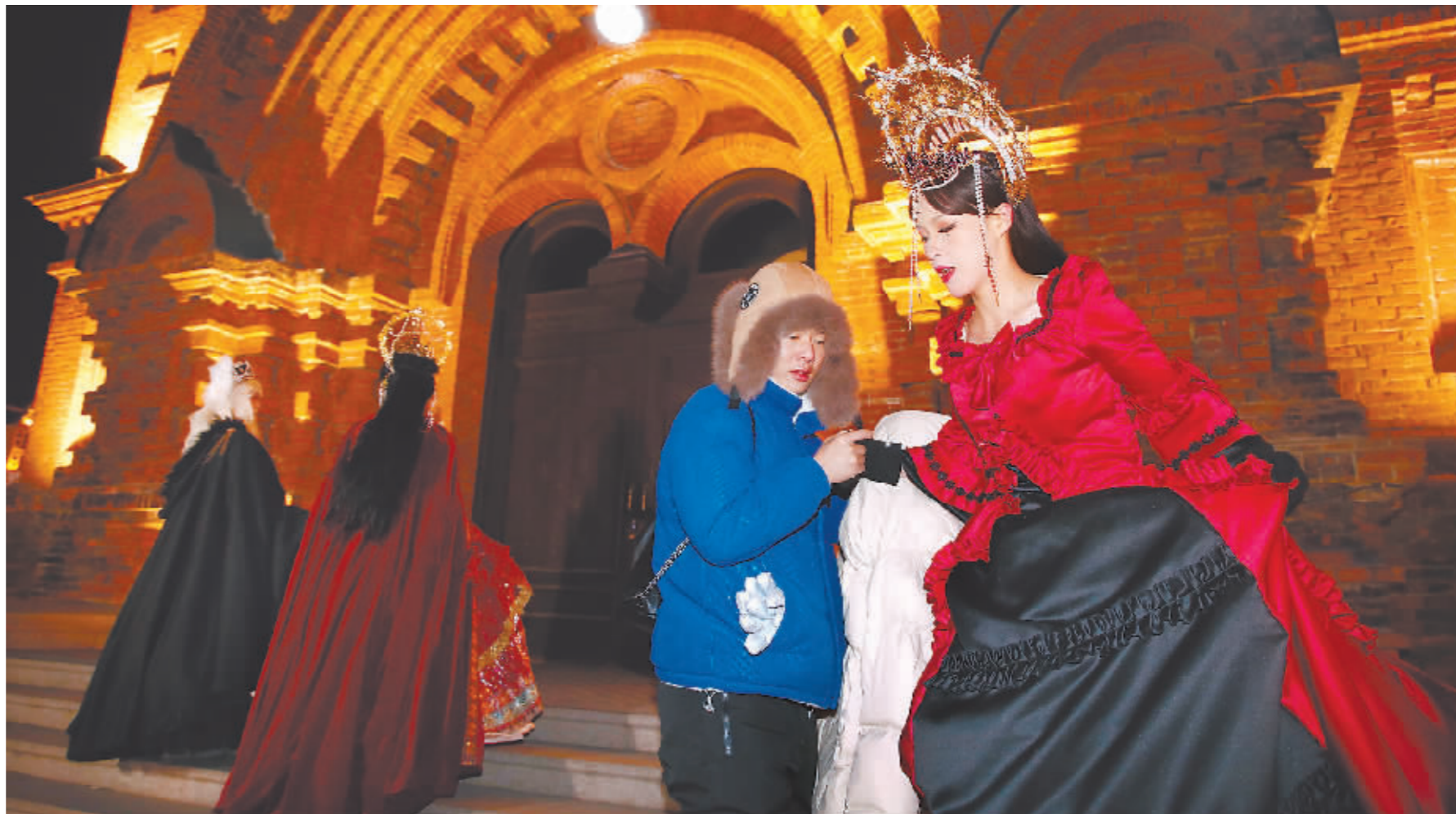
建筑艺术广场上「女王」扎堆。

仅仅一个月,哈尔滨俄罗斯公主冬日旅拍在网络上迅速火爆起来并形成一种现象,先后被齐鲁晚报、河北电视台等多家媒体报道。哈尔滨俄罗斯公主系列也多次被哈尔滨文旅局等多个官方账号转载。业内人士预测,哈尔滨冬日旅拍是在全国冰雪热的背景下产生的,随着哈尔滨冰雪节的到来,旅拍客流将会达到最高峰,并将持续整个冰雪季。