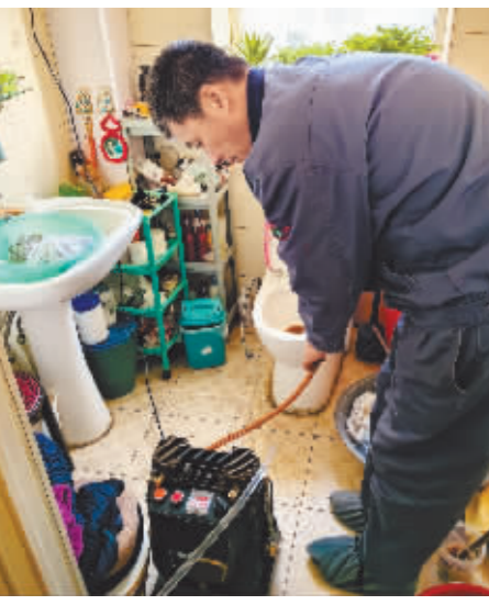
捷能热力工作人员上门免费检查和清洗地热。

改签地址:道外区哈东路56号 工作时间:上午8:30—11:30 下午13:30—16:30 哈尔滨棚户区改造投资有限责任公司 道外区房屋征收服务中心 2023年12月12日