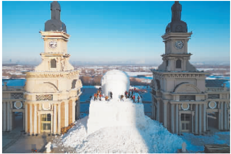
音乐公园网红大雪人正抓紧建设。

冰雪演艺、冰雪建筑、冰雪活动、冰雪体育于一体的冰雪乐园……魅力冰城,盛装以待,邀请八方来客共享北国好风光。