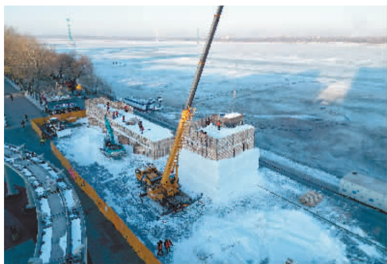
松花江冰雪嘉年华开始制作雪场。