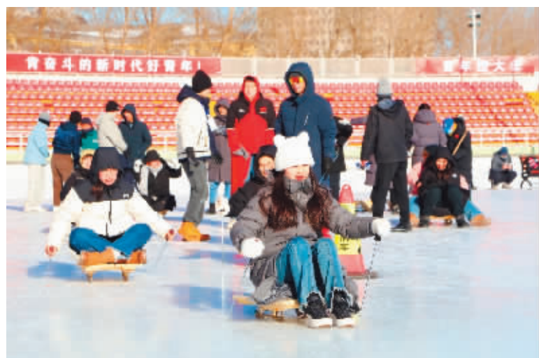
哈工大学子参加校园冰雪趣味运动会。