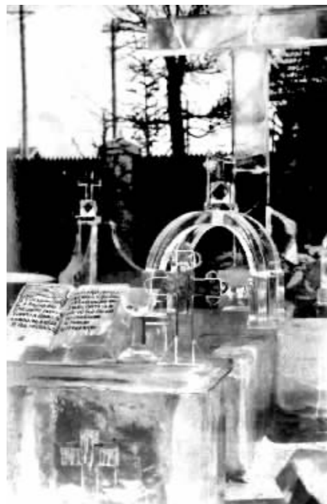
清代哈尔滨中央大街冰雕。

郭阎梅说,在清代民间还流行“轱辘冰”的习俗,每当正月十六晚上,妇女们会三五成群,手执灯笼,嬉笑着来到旷野,横卧于冰雪之上,左右翻转滚动,嘴里不住地诵唱道:“轱辘冰轱辘冰,腰不痛腿不疼”,“轱辘轱辘冰,身上轻一轻。”接着,在冰上戏闹取乐,俗称为“脱腿气”。当时的冰上运动丰富多彩,有打冰尜、滑冰车、溜冰等等。