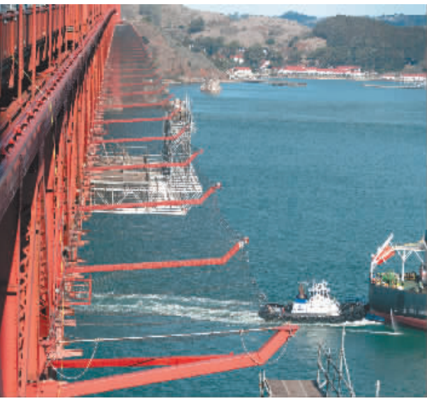
这是11月30日拍摄的美国旧金山金门大桥自杀防护网。

中新网消息 经过5年多的建设,耗资高达2.17亿美元的美国旧金山金门大桥自杀防护网项目将于今年年底完工。