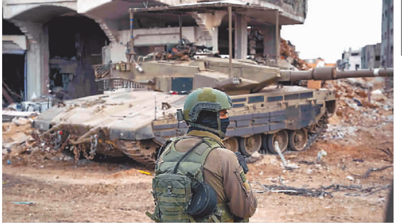
图为12月1日,一名以军士兵在加沙地带参加军事行动。

巴勒斯坦消息人士告诉新华社记者,以军已对加沙地带北部、中部和南部多个地区发动空袭,并与巴方武装人员在加沙城等地发生激烈冲突。