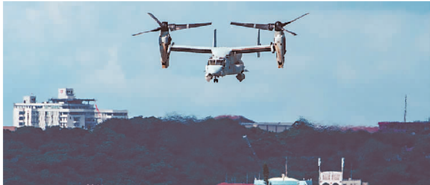
这是在日本冲绳县宜野湾拍摄的一架美军“鱼鹰”运输机。

据新华社电 驻日美军一架“鱼鹰”运输机11月29日在日本海域坠落后,日本政府多次请求美军暂时停飞该型号事故多发的军机,但美方并未理会,而是强调目前重点是搜救失踪人员。日本政府发言人12月1日对驻日美军“鱼鹰”继续飞行表达忧虑。