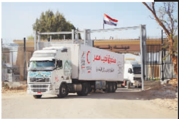
运送救援物资的卡车进入拉法口岸加沙一侧。