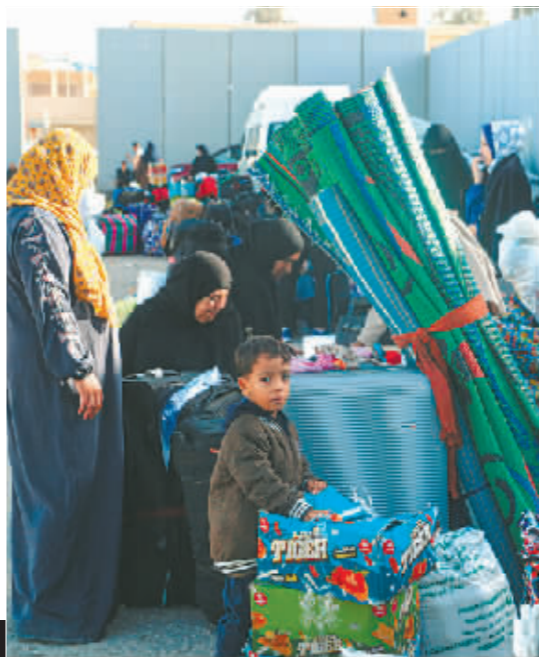
在拉法口岸埃及一侧,巴勒斯坦人等待进入加沙地带。