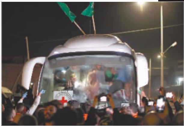
在约旦河西岸城市拉姆安拉附近的拜图尼亚镇,获释的巴勒斯坦人乘车离开。