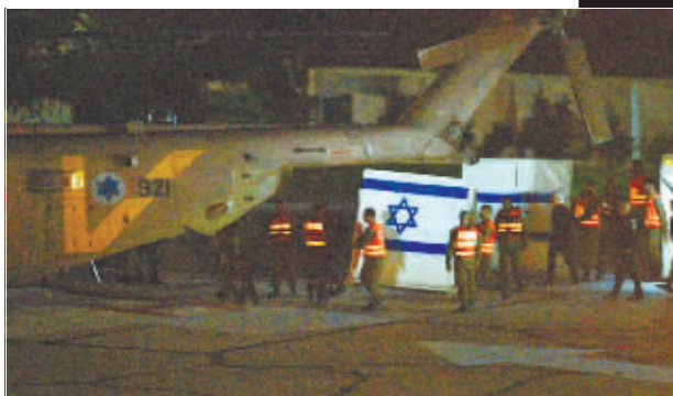
11月24日,搭载获释人员的直升机抵达以色列佩塔提克瓦一所医院。

巴勒斯坦伊斯兰抵抗运动(哈马斯)与以色列在加沙地带的临时停火协议24日生效。记者在现场看到,时隔近50天后,加沙地带、以色列与黎巴嫩边境地区暂时重归平静。