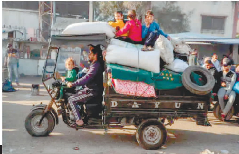
11月24日停火生效后在加沙地带南部城市汗尤尼斯拍摄的街头景象。